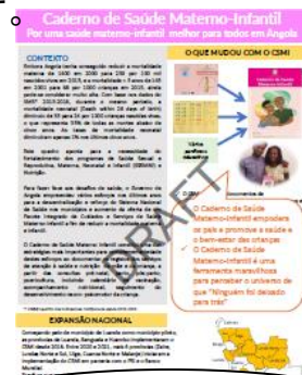
リーフレットの案