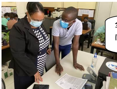
全国展開戦略やリーフレットについてのミーティング

アンゴラ保健省は、2025年までの母子健康手帳の全国展開を目指しています。そのため、プロジェクトでは、国家公衆衛生局カウンターパートと協力して、手帳の全国展開をサポートするための戦略資料「全国展開戦略」の作成を進めています。全国展開戦略には、「母子健康手帳の概要」、「ステークホルダーの役割」、「導入戦略」、「全国展開のスケジュール」、「全国展開にかかる費用」等が書かれています。特に、「導入戦略」には、アドボカシー会合、指導者研修、医療従事者研修、施設内研修、KASSAI (e-learning モジュール)、モニタリング&スーパービジョン (M&S)、コミュニティ啓発活動等の導入に必要な活動の概観が記載されています。「全国展開戦略」の後半は各キットで構成されていて、母子健康手帳の導入に関する教材ツール等は「テクニカルキット」として、母子健康手帳の意義や期待される効果を周知するために必要なツールは「アドボカシーキット」として、費用計算に必要なツールは「計算キット」として添付されています。