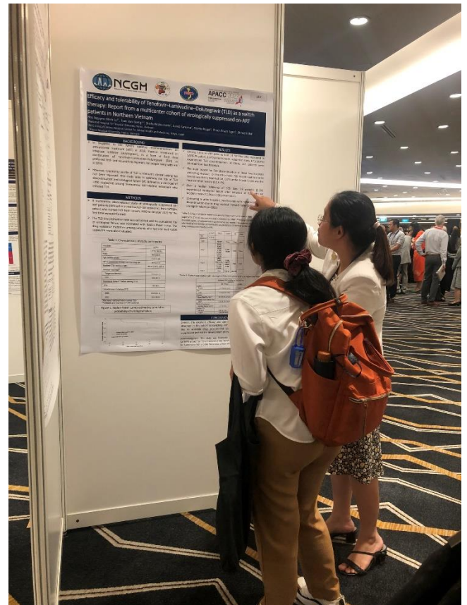
会場ではポスターを見た参加者に内容を説明し、その場で質問に答え、熱心な意見交換が行われました。

SATREPS プロジェクトも最終年度となり、これまでの研究を学会や論文など様々な形で発信していくことにも力を入れています。今回、ベトナムの研究者がプロジェクト活動内容を基に学会を通じた国際的な場で発表できたことは、共同研究を重ねてきた成果の一つと言えるでしょう。今後も更にプロジェクト成果の発信に力を入れていきたいです。