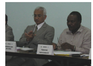
Le Président de séance et le Représentant de l'Ambassade du Japon à Cotonou lors de la 1 ère session ordinaire du Comité Conjoint de Coordination du Projet