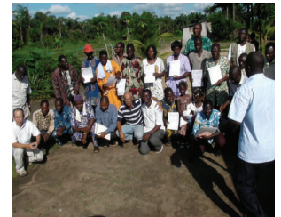
Vue d'ensemble des formateurs et des stagiaires

Les communes de Tori-Bossito et d'Avrankou, où des formations « fermier à fermier » sur l'aquaculture avaient été dispensées dans le cadre du Projet d'Etude de la Promotion de l'Aquaculture Continentale en République du Bénin (PACODER) montrent les impacts positifs de la vulgarisation.