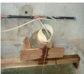
Un incubateur d'œufs de poissons

Des essais sont en cours dans des fermes piscicoles en vue d'apporter des solutions aux difficultés techniques enregistrées sur le terrain.