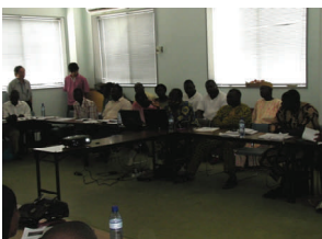
Vue partielle des participants à un séminaire libre et gratuit sur la pisciculture

Le Projet a organisé des séminaires sur les Techniques aquacoles de l'Égypte et la Fabrication des aliments et leur évaluation afin de diffuser et transférer les informations techniques disponibles au grand public.