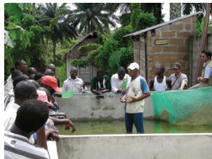
L'un des temps forts de la formation des pisciculteurs clés et des techniciens en production halieutique

L'état des lieux de la pisciculture a été réalisé et les résultats de cette étude ont été utilisés comme données de base pour sélectionner les communes cibles et les pisciculteurs-clés, pour examiner les indicateurs du cadre logique et pour étudier le contenu des essais sur site.