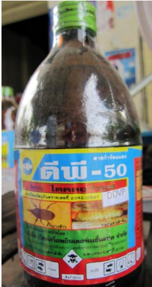
ឈ្មោះពាណិជ្ជកម្ម : ឌីឌីវីកី Trade Name: DDVP