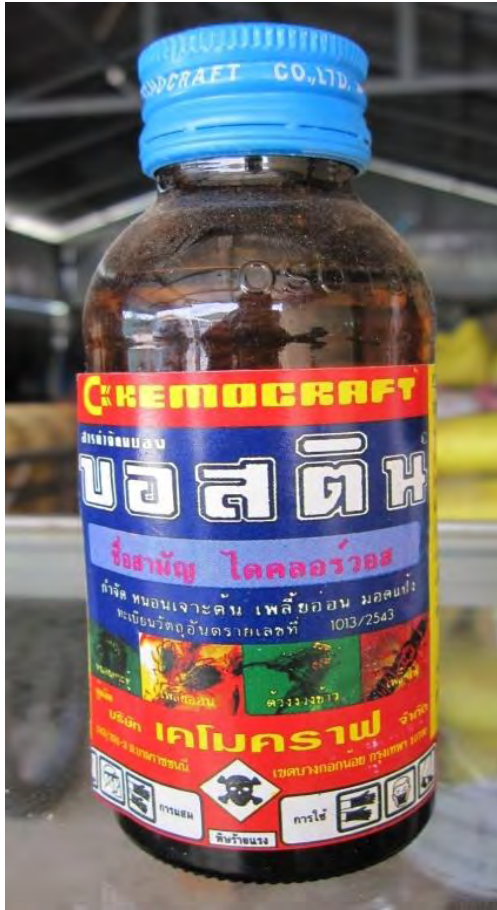
ឈ្មោះពាណិជ្ជកម្ម : ( ឈ្មោះជាភាសាថៃ ) Trade Name: (Thai language)