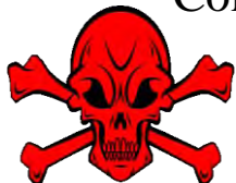
ឈ្មោះទូទៅ : ឌីក្លរវ៉ុស Common Name: dichlorvos