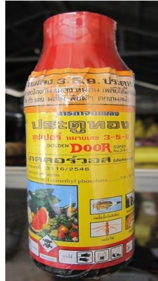
ឈ្មោះពាណិជ្ជកម្ម : ហ្គោលដ៊ិន ដរ Trade Name: Golden Door