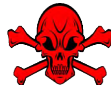
ឈ្មោះទូទៅ : ឌីក្លរវ៉ុស Common Name: dichlorvos