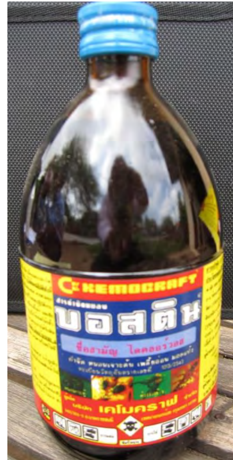
ឈ្មោះពាណិជ្ជកម្ម : ( ឈ្មោះជាភាសាថៃ ) Trade Name: (Thai language)