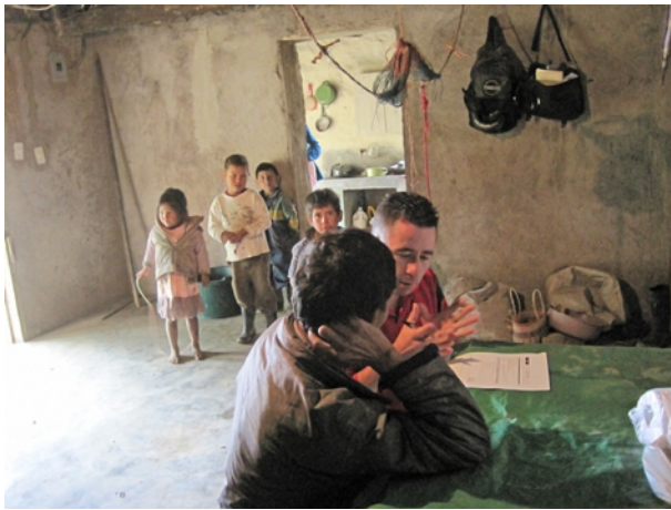
3. Líder levantando información en un hogar