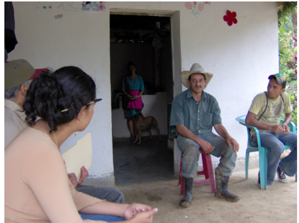
4. Técnicos facilitadores supervisando levantamiento en un hogar