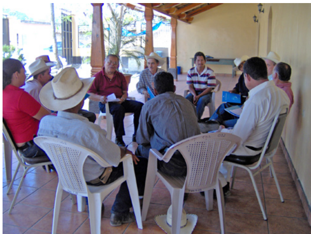
5. Validando resultados de una comunidad