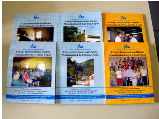
6. Informes municipales de línea de base en seis municipios pilotos