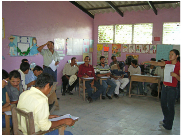
2. Líderes comunitarios recibiendo capacitación