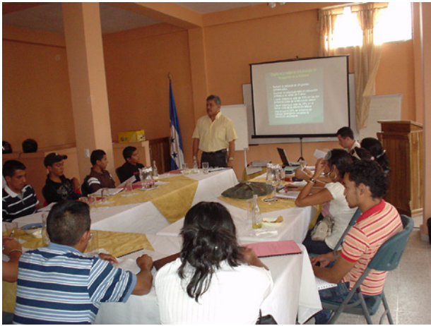
1. Técnicos facilitadores recibiendo capacitación