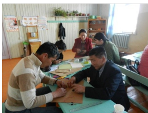
Загвар аймаг, дүүргийн загвар бус сургуулиудад зориулсан сургалтын явц