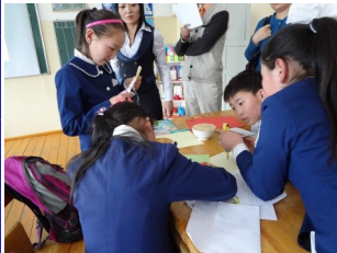
Архангай аймгийн зориулсан сургалтын явц (Зураг 1: Бага ангийн математикийн баг Зураг 2: Физикийн баг Зураг 3: Хүн байгалийн судалгаат хичээл)