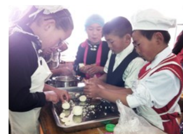
4-р ангийн Төсөлт ажил судалгаат хичээл /Булган/