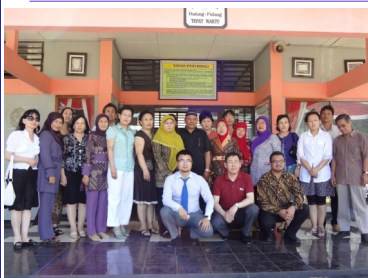
Сүмэдан аймгийн Жатинангүр дунд сургуульд