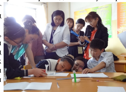
Физикийн судалгаат хичээл (Гэрлийн хугарлын туршилт)

Зөвлөгөөний сүүлийн өдөр оролцогчдоос асуулга судалгаа авч үзэхэд, бүх тайлан илтгэлийн сэтгэл ханамж 5 үзүүлэлт бүхий үнэлгээгээр 4-өөс дээш гэсэн үнэлгээ авчээ. Судалгаат хичээлийн тухайд, ялангуяа хэлэлцүүлэг зохион байгуулсан нь хичээлийн судалгааны талаархи ойлголтоо дээшлүүлэхэд хэрэг болсон гэсэн байв. Цаашид, орон нутгийн түвшинд багшлахуйн арга зүйн шинэчлэлийг зохион байгуулахад Боловсролын газрын идэвхитэй оролцоо, бүс нутаг болон сургуулиуд хооронд туршлага солилцох явдал чухал гэсэн санал олноор гарсан юм.