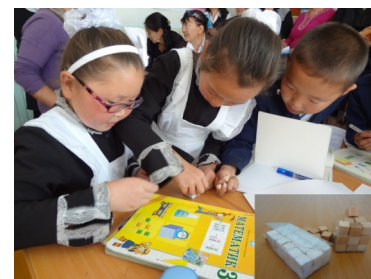
Бага ангийн Математикийн судалгаат хичээл /Тосонцэнгэл/

Гэхдээ, дээрхи загвар аймаг, дүүргийн сургуулиудад хэт их өнгийн цаас, өнгийн пламастер, проектор зэргийг ашигласан “Харагдах байдалдаа анхаарсан” хичээл, багш нь хүүхдээ сайн ойлгохгүй байгаа хичээлүүд ч харагдаж байсан. Цаашид ч, хүүхдүүдийн хичээлээ ойлгож буй эсэхийг тандах аргыг бодож олох нь чухал. Хүүхдүүдийн дэвтрийг шалгаж үзэх ч бас л нэг арга юм.