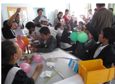
Өмнөговь аймгийн сургалт: Судалгаат хичээлийн явц