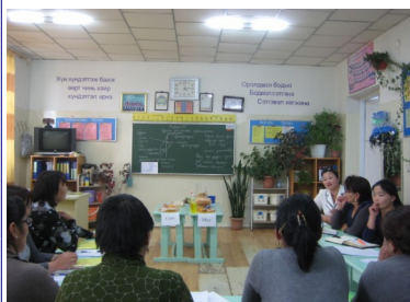
Өвөрхангай аймгийн сургалт: Судалгаат хичээлийн дараахи хэлэлцүүлэг

Эдгээр сургалт нь загвар бус аймгийн суралцахууд суурилсан багшлах арга зүйг түгээн дэлгэрүүлэхэд ихээхэн дөхөм үзүүлсэн гэдэгт итгэж байна.