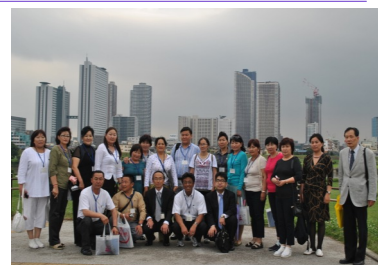
Минэмачи бага сургуулийн захирал, хичээлийн эрхлэгчийн хамт (Токио хот, Оота дүүрэг)

Сургалтын төгсгөлд оролцогчид сурч мэдсэн зүйлээ тус бүрийн аймаг, сургуульдаа хэрхэн хэрэгжүүлэх тухай төлөвлөгөө боловсруулсан. Уг төлөвлөгөөнд самбар төлөвлөлтийг сайжруулах, сургуулийнхаа зорилго, зорилтыг оновчтой тодорхойлох, бага сургуулиудад ном уншлагын цагтай болох зэрэг зүйлүүдийг тодорхой тусгасан байлаа. 8 сарын сүүлд зохион байгуулагдсан “Багш нарын бага хурал”-ын үеэр ч Япон дахь сургалтын үр дүнг танилцуулсан. Энэ маягаар оролцогчид Японд үзэж сонссоноо зөвхөн өөрсдөө бус, сургууль болон аймагтаа танилцуулахыг хүсч байна.