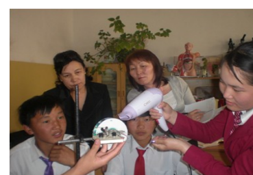
Хэнтий аймгийн мониторинг: Физикийн хичээл дээр хүүхдүүд туршилт хийж байгаа нь