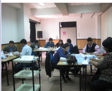
Дунд ангийн Математикийн хичээлийн дадлага ажил

Сургалтын төгсгөлд дээрхи сургуулиуд тус бүр сургалтын төлөвлөгөө, хөтөлбөртөө “Хичээлийн судалгаа” хичээлийг тусган оруулах боломжийн талаар хэлэлцэж, давуу болон сул талаа тодорхойлон ярилцсан юм.