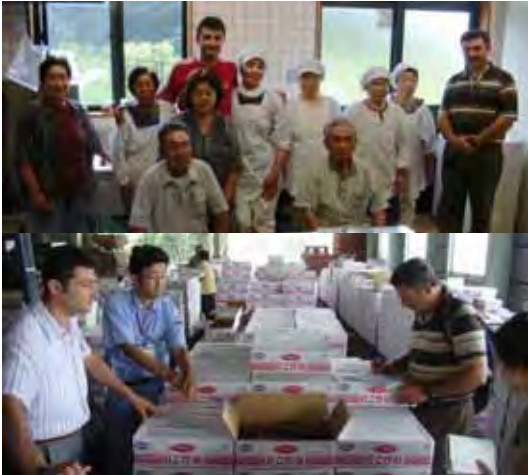
Çiftçi Grubu ve Tarım Kooperatifi Farmers' Group and Agricultural Cooperative

Türkiye'ye döndükten sonra, eş uzmanlar bulgularını ve eylem planlarını 4A Semineri'nde meslektaşlarıyla paylaştılar.