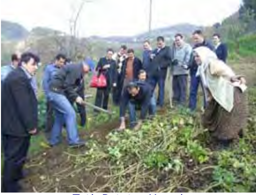
Tatlı Patates Hasadı Harvest of Sweet Potatoes

Seminerin ilk gününde, Proje Ekibi, katılımcıları son ilerlemeler konusunda bilgilendirdi. İkinci günün en önemli konusu Model ve Yayım Projeleri'nin uygulama yöntemi idi. Diğer dersler pazarlama bilgisi, sunu yapma- iletişim becerileri ve çiftlik ekonomisi konularındaydı. Seminerin üçüncü günü, katılımcılarla birlikte alan incelemesi ve çiftçilerle görüş alış-verişi için Akçaabat'a bir tarla gezisi düzenlendi, tatlı patates ve çilek hasadı yapıldı. Seminerin son günü, katılımcılarla yayım projesinin uygulanışı konusunda tartışıldı.