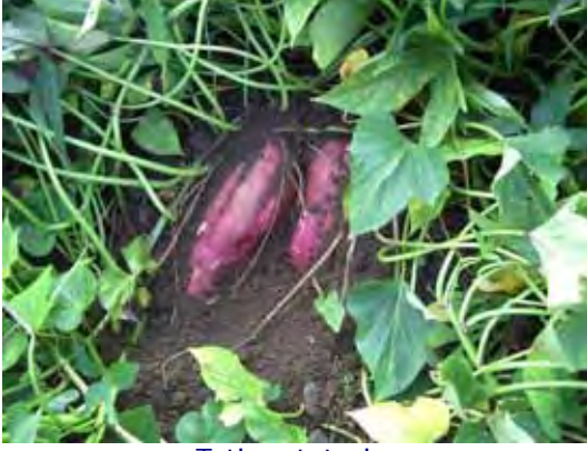
Tatlı patatesler Products of Sweet Potato