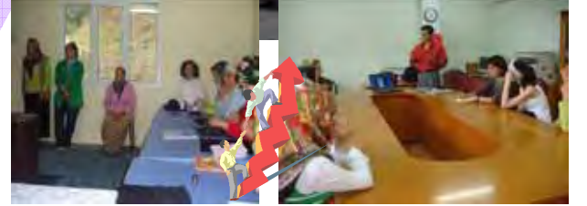
Darıca'dan Görüntüler Views of Darıca