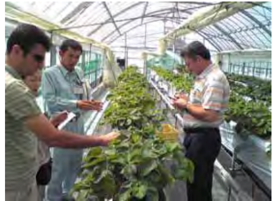
Çilek Yetiştiriciliği Araştırması Research of Strawberry Cultivation

After return back to Turkey, they presented the findings and the action plan to their fellows at Seminar 4A.