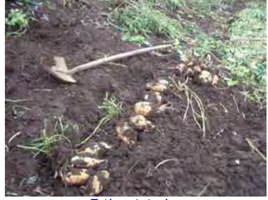
Tatlı patatesler Products of Sweet Potato