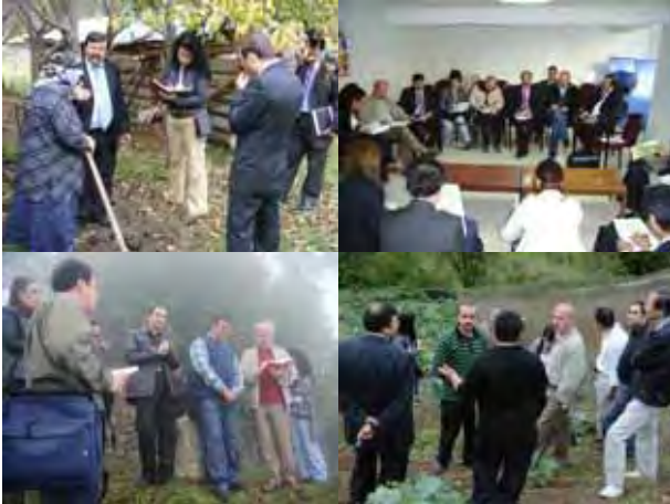
Alan incelemesi ve tartışmalar Field Investigation and Discussions

Ekim ayı sonunda, projenin ikinci yarısı için önerilerde bulunulması amacıyla Orta Dönem Değerlendirmesi yapıldı. Türk ve Japon uzmanlardan oluşturulan karma bir ekip adil bir değerlendirme yaptı. Değerlendirme Ekibi, anket, mülakat, alan incelemesi ve mevcut dokümanların gözden geçirilmesi vb. çalışmalarda bulundu.