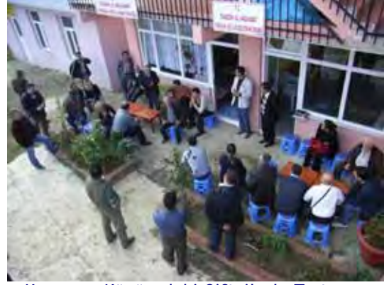
Kuruçam Köyü'ndeki Çiftçilerle Tartışma Discussion with Farmers in Kuruçam

The Project Team explained recent progress of the Project on the first day. The main issue on the second day was the implementation method of the model and extension project. The issues on marketing information, presentation, communication and farm economy were included. On the third day, the participants had a field trip to Akçaabat for site inspection and discussions at Kuruçam, harvesting of sweet potatoes, and harvesting of strawberry. On the last day, they discussed about implementation of the extension project.