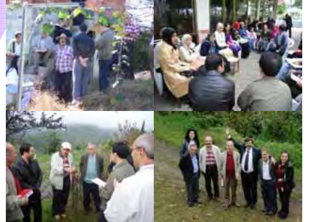
Alan incelemesi ve tartışmalar Field Investigation and Discussions

In the second half of October 2008, the mid-term evaluation was carried out to make suggestions for the second half of the period. The JICA members and Turkish members formulated the joint team to conduct the fair evaluation. The evaluation team conducted questionnaire and interview survey, field inspection, review of documents, etc.