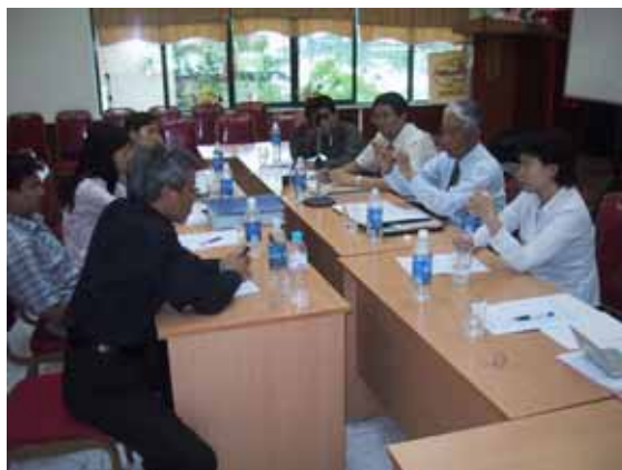
Gặp gỡ, thảo luận