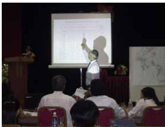
Gặp gỡ, thảo luận