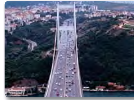
トルコの第2ボスポラス橋

一定以上の所得水準を達成している開発途上国を対象に、長期返済・低金利という緩やかな条件で開発資金（円貨）を貸し付けるもの。多くの資金を要する大規模インフラなどにあてられます。