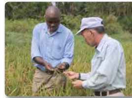
ウガンダでの農業支援

開発途上国の人材育成、制度構築のために、専門家の派遣、必要な機材の供与、途上国人材の日本での研修などを行うもの。幅広い課題に対応する協力内容をオーダーメイドに組み立てられます。