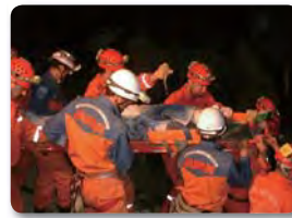
アルジェリアで活動する 国際緊急援助隊

海外で大規模な災害が発生した場合、被災国政府や国際機関の要請に応じて、日本政府の決定のもと国際緊急援助隊を派遣します。被災者の救助と救援物資の供与を行っています。