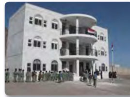
イエメンでの小中学校建設

所得水準が低い開発途上国を対象に、返済義務を課さずに開発資金を供与するもの。学校、病院、井戸、道路などの基礎インフラの整備や医薬品、機材などの調達にあてられます。