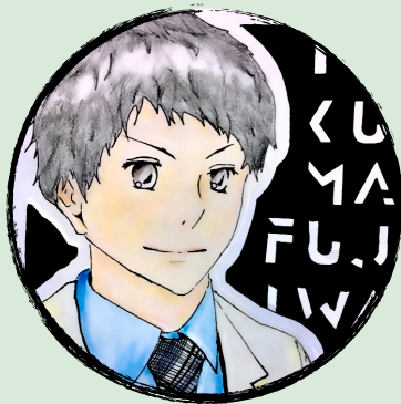
上の似顔絵は、中学校勤務時に卒業生が描いてくれたもの

私自身のことについて、まずは簡単に自己紹介をさせてください。私が協力隊になるまでの経歴や動機が、協力隊事業に関心をもつ全ての人の参考になれば幸いです。