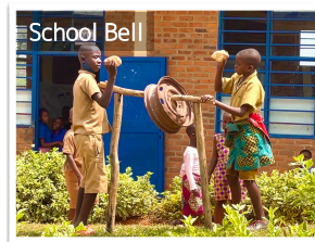
↑ 休み時間終了の合図

ちなみに、先生方は携帯電話を持っているので、時間を確認することができます。しかし、それでも時間割通りに授業が進んでいるのを見たことがありません。日本人の感覚としては「え、それで良いの?」と思ってしまいますが、彼らは誰もそこに疑問を感じていないようです。