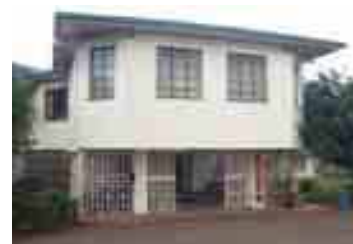
ナイロビ日本人学校 ケニア 27