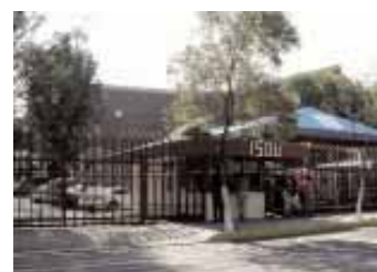
日本メキシコ学院

日本メキシコ学院には、日本人子女のための日本コースと、日系2・3世およびメキシコ人のためのメキシココースが併設されており、海外日本人学校としては唯一の現地校併設の学校である。日本コースは幼稚園から中学校まであり、日本の文部科学省のカリキュラムに基づいて運営され、教師も文部科学省から派遣されている。メキシココースは幼稚園、小学校、中学校および高校まである。連絡先などはPart3イエローページを参照。