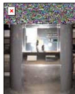
空港タクシーチケット売り場

メキシコ人は、ハンドルを持つとせっかちになる傾向がある。かなりのスピードを出し、右左折のウインカーも出さない。また無理な割り込み、追い越しなどもあ