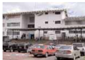
日本人学校 ベネズエラ 33

日本語の本などは現地では手に入らない。学校で使うドリルなどの教材は、学校で一括して購入してもらえる。ベネズエラに赴任する際は、日本からメールなどで日本人学校に連絡