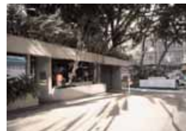
アルタミラ・スイーテス