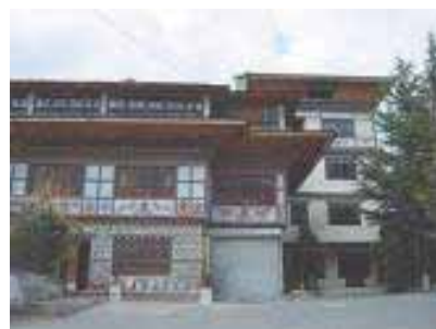
Yeedzin Guest House