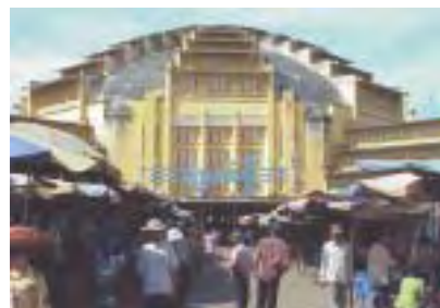
Phsar Thmey （プサー・トゥマイ・中央市場）