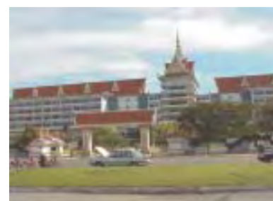
Hotel Cambodiana Phnom Penh

上記のほか、より低料金のホテル、ゲストハウスが多数あるが、安全面で不安があり、利用は勧められない。なお、カンボジアでは上記の高級ホテル以外はクレジットカードの使用は難しい。また、トラベラーズチェックは銀行での換金を含め、使用時に高率の手数料が必要となるので注意を要する。「円」より「米ドル」のほうが便利。