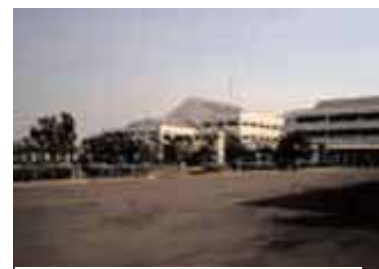
ジャカルタ日本人学校

ジャカルタ日本人学校がある(詳細は Part3 イエローページを参照)。生徒数は 2007 年 2 月 15 日現在、小学部 598 人、中学部 209 人、幼稚部 179 人が在籍している。