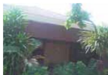
Sejahtera Apartment & Hotel