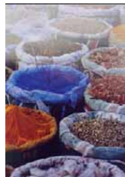
市場の風景。さまざまな乾燥野菜や香辛料が売られている。

また、衛生観念の違いから、食料品の取り扱いが日本と異なることがある。現地の日本人などからの情報で、なるべく商品の回転が速く、清潔な店を探して購入することをお勧めする。