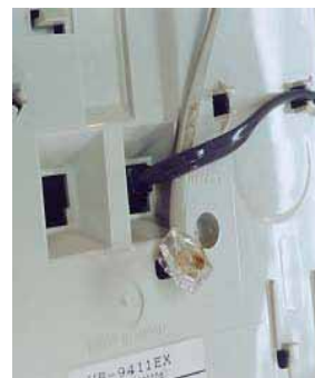
モジュージャック。大きさが2種類あり、アダプターが必要なものがある。