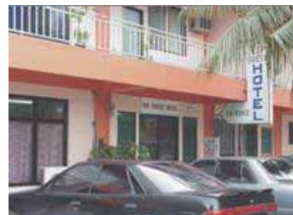
VIP Guest Hotel