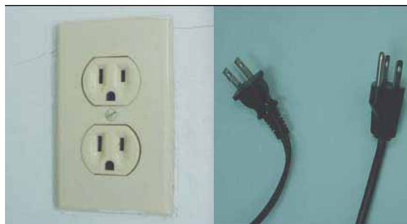
パラオで一般的なコンセント

住居につけられているコンセントは3つ穴だが、ひとつはアース用なので、日本と同様のプラグで十分に使える。モジュラージャックは日本と同じタイプとオーストラリアタイプの両方がある。