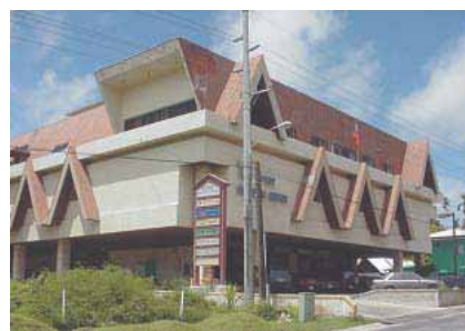
WCTC Shopping Center