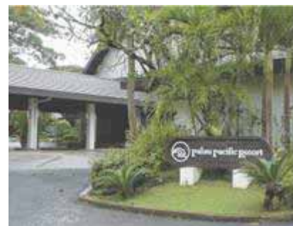
Palau Pacific Resort

パラオに駐在している日本人の大部分はアパートに住んでいる。条件のよい一軒家の空きはあまりない。現在、日本人の居住している家屋の平均的な家賃は、一軒家、長期滞在型ホテル、アパートともに月額1000～1200米ドル前後である。以前に比べれば住宅事情もかなり改善されたが、好みの住宅を探すのは大変難しい。