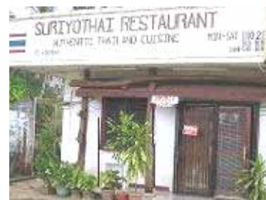
タイ料理レストラン スリヨタイ パラオ 7