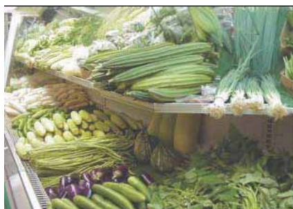
スーパーマーケット店内