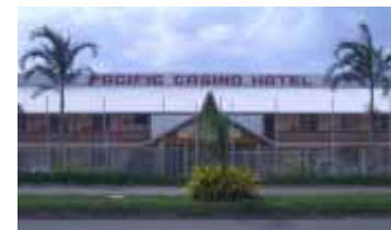
パシフィック・カジノ・ホテル