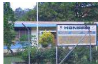
ホニアラ市立図書館