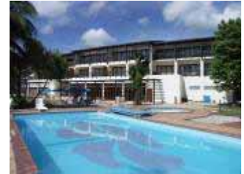
ソロモン・キタノ・メンダナ・ホテル