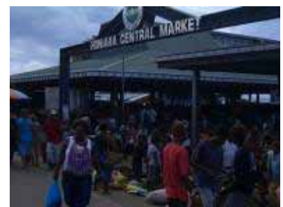
ホニアラ中央市場

新鮮な魚などは、中央市場(日曜休み)とククムのフィッシュマーケット(土曜休み)で入手できる。ククムハイウェイ沿いには何ヶ所か漁師が直売を行う露店が出る。一部スーパーマーケットには、冷凍の切り身、エビ、イカ類、スモークサーモンなどを置いて