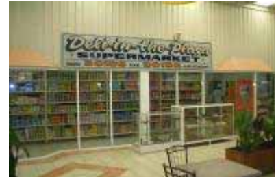
デリ・イン・ザ・プラザ