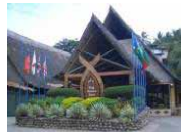
キング・ソロモン・ホテル