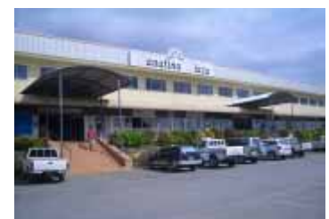
パナティナ・プラザ