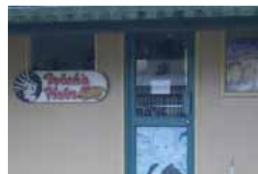
トリッシュ・ヘアサロン