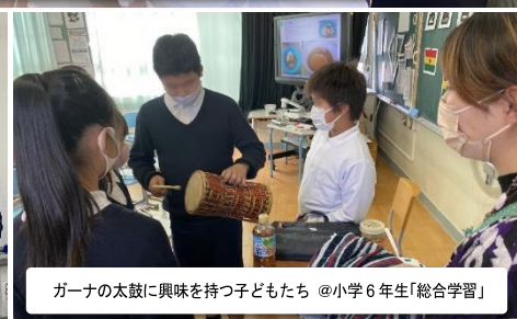
ガーナの太鼓に興味を持つ子どもたち @小学6年生「総合学習」

実際に途上国で国際協力に携わってきた JICA 海外協力隊（青年海外協力隊、シニア海外協力隊）の OB・OG などを講師としてみなさまのもとに紹介し、生きた体験談をご提供します！