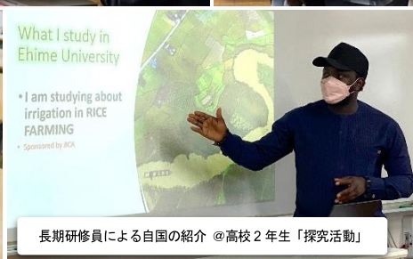
長期研修員による自国の紹介 @高校2年生「探究活動」