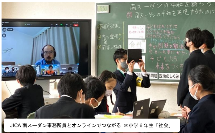
JICA 南スーダン事務所員とオンラインでつながる @小学6年生「社会」