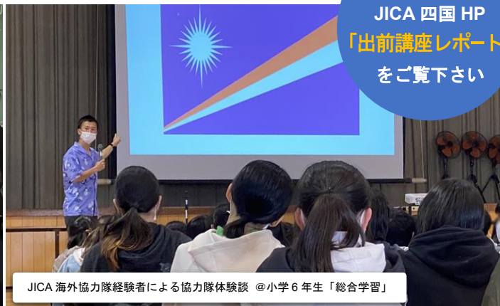
JICA 海外協力隊経験者による協力隊体験談 @小学6年生「総合学習」