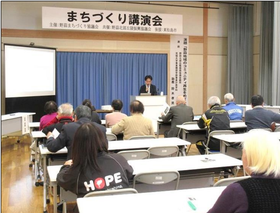
まちづくり講演会の様子

※鳴瀬サロンは東松島市鳴瀬地区から仙台市などに移転、避難している人々が仙台市青葉区中央市民センターにて毎月第二土曜日に開催しているサロンです。