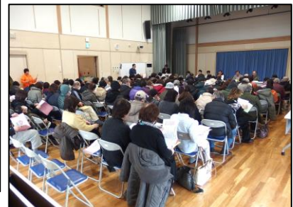
説明会当日の様子

当日は96世帯約130名の入居予定者が集まり、住戸位置決め用配置図を確認しながら位置決めに関する手続き、スケジュール等の説明を受けました。