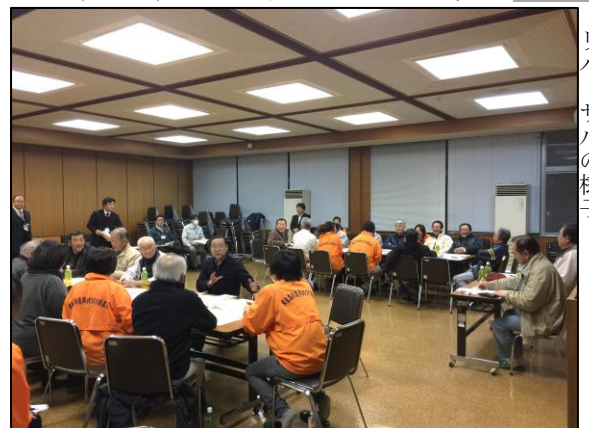
地区自治会の地区割り検討会 リハーサルの様子