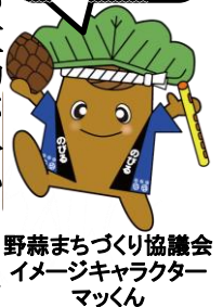
野蒜まちづくり協議会イメージキャラクター マックン

最後に、新しいまちを舞台に、野蒜の皆さままで新しい住宅地のまちづくりにご参加してくださいと締め括られました。