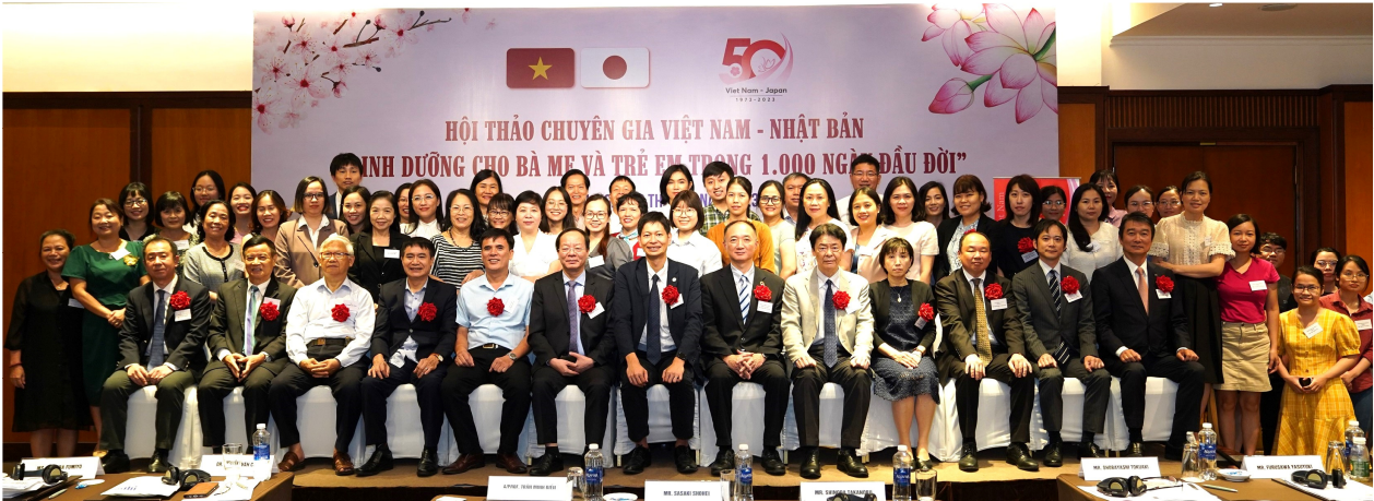
Các đại biểu tham dự hội thảo

Ngày 30/09/2023, Bệnh viện Nhi Trung ương, Hội Nhi khoa Việt Nam và Hội Dinh dưỡng Việt Nam đã tổ chức "Hội thảo chuyên gia Việt Nam - Nhật Bản về dinh dưỡng cho Bà mẹ và Trẻ em trong 1.000 ngày đầu đời" tại Hà Nội, trong khuôn khổ Dự án "Khảo sát kiểm chứng thương mại hóa cải thiện sức khỏe Bà mẹ và Trẻ em trong 1.000 ngày đầu đời tại Việt Nam" bắt đầu thực hiện tại Việt Nam từ tháng 7/2023 bởi Cơ quan Hợp tác Quốc tế Nhật Bản (JICA) và Công ty cổ phần Asahi Group Foods (Trụ sở chính tại Tokyo).