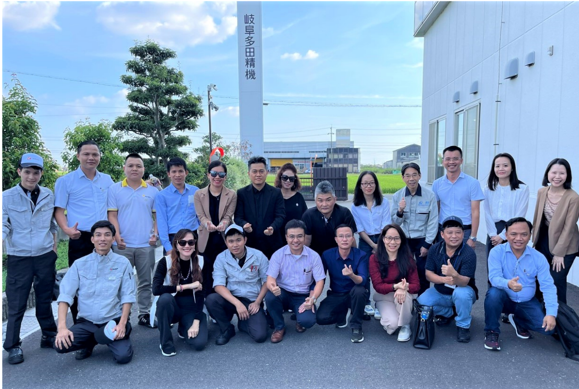
Các học viên tham quan nhà máy tại Nhật Bản

Vừa qua, từ ngày 10-17/9, đoàn học viên Việt Nam gồm 14 người, trong đó có 12 giám đốc doanh nghiệp và 2 đại diện Cục Phát triển doanh nghiệp - Bộ Kế hoạch và Đầu tư, đã đến Nhật Bản tham dự Khóa đào tạo nâng cao năng lực quản trị doanh nghiệp.