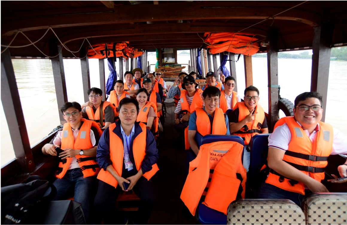
Đoàn báo chí trên đường tới thăm mô hình nuôi lươn tuần hoàn tại huyện Cái Răng, Tp. Cần Thơ

Trong các ngày 27-29/9/2023, JICA đã tổ chức một chuyến tham quan thực địa dự án của JICA tại Đồng bằng sông Cửu Long (ĐBSCL) cho 10 cơ quan báo chí Việt Nam.