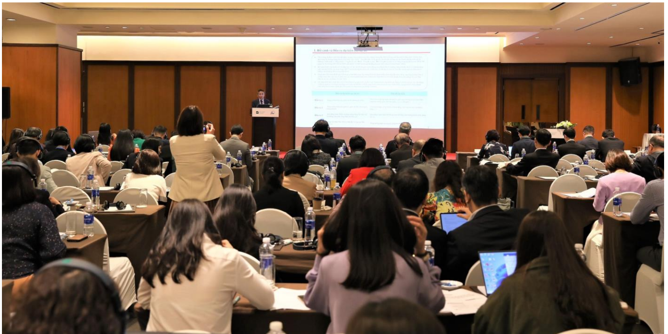
Toàn cảnh Hội thảo