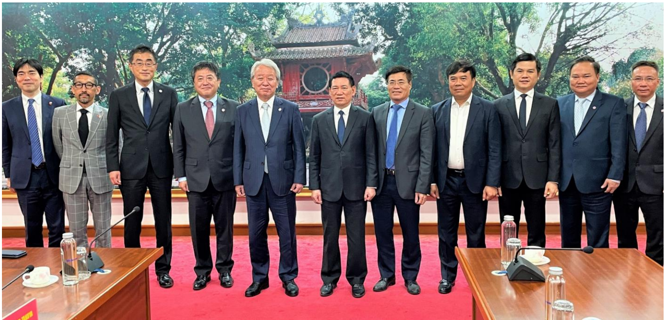
Chủ tịch JICA - ông Tanaka Akihiko (thứ 5 từ trái sang) chụp ảnh với Bộ trưởng Bộ Tài chính Hồ Đức Phúc (thứ 6 từ trái sang) sau buổi hội đàm

Bộ trưởng Hồ Đức Phúc đánh giá cao những đóng góp của JICA cho Việt Nam thông qua tài trợ ODA, đồng thời bày tỏ mong muốn tăng cường hợp tác hơn nữa trong thời gian tới. Hai bên nhất trí việc huy động nguồn vốn ODA có sự tham gia của khu vực tư nhân thông qua hình thức hợp tác công tư và thúc đẩy phát triển nguồn nhân lực là động lực phát triển của hai nước.