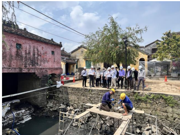
Các chuyên gia tư vấn về dự án trùng tu Chùa Cầu

Trong thời gian ở Hội An, các chuyên gia đã khảo sát Chùa Cầu, và tư vấn về mặt kỹ thuật đối với công tác xây dựng nhà bao che thi công phần mái, một phần quan trọng trong quá trình trùng tu Chùa Cầu.