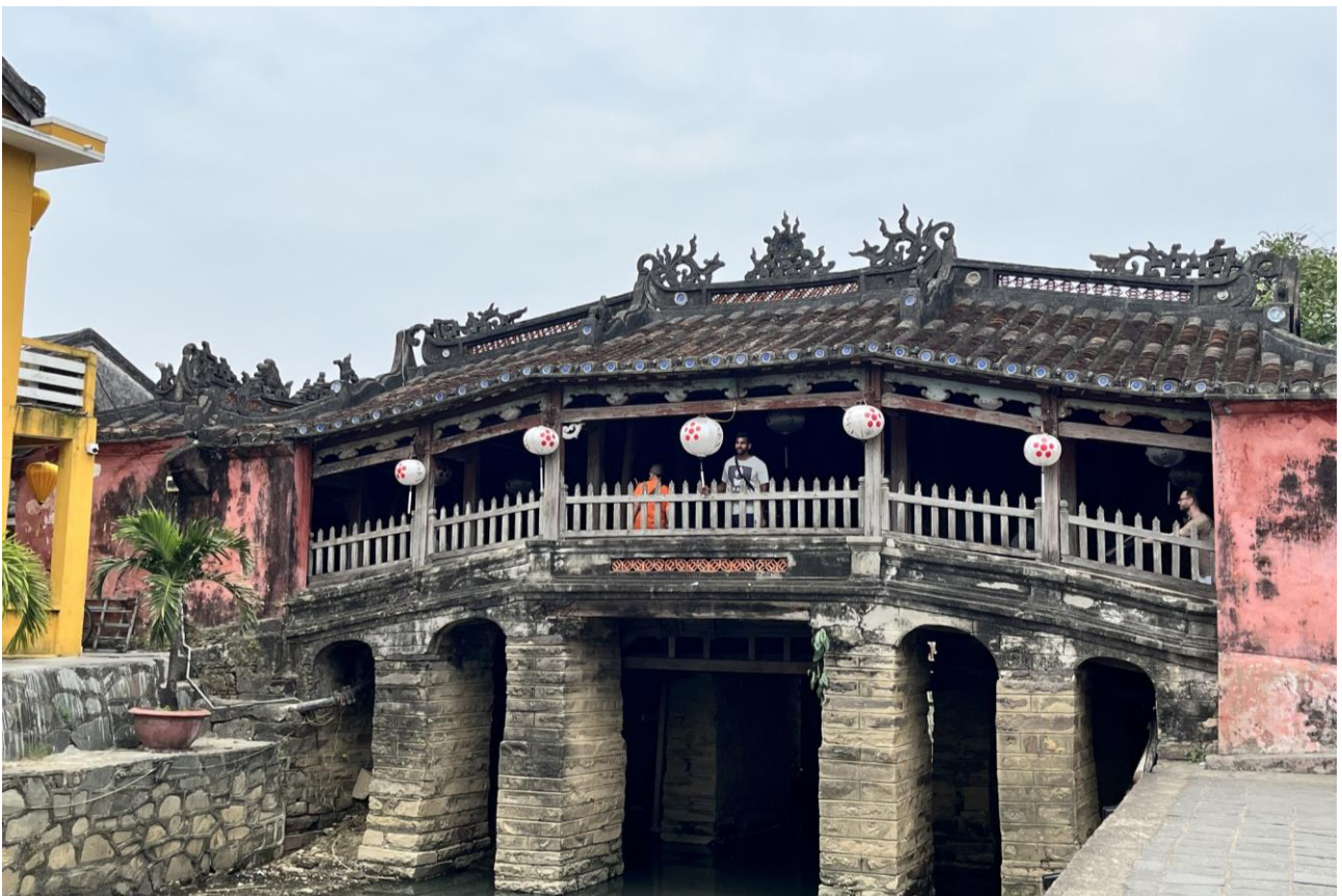
Hiện trạng của Chùa Cầu đang trong quá trình trùng tu