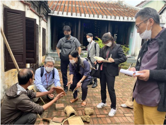
Các chuyên gia nghe thuyết trình về phương pháp sản xuất từ nghệ nhân ngôi âm dương tại làng gốm Thanh Hà, Tp. Hội An

Ngoài ra, các chuyên gia cũng có buổi làm việc với Ủy ban Nhân dân thành phố Hội An và Trung tâm Quản lý Bảo tồn Di sản Văn hóa Hội An. Hai bên trao đổi và thảo luận chi tiết về Dự án tu bổ Chùa Cầu hướng tới mục tiêu hoàn thành dự án này trong năm 2023, kỷ niệm 50 năm thiết lập quan hệ ngoại giao giữa Việt Nam và Nhật Bản.