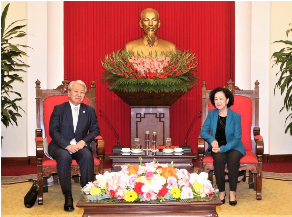
Chủ tịch JICA - ông Tanaka Akihiko hội đàm với Thường trực Ban Bí thư, Trưởng ban Tổ chức Trung ương Đảng Trương Thị Mai

JICA tiếp tục cử chuyên gia Nhật Bản hỗ trợ kỹ thuật tu bổ Chùa Cầu, Hội An (Trang 4)