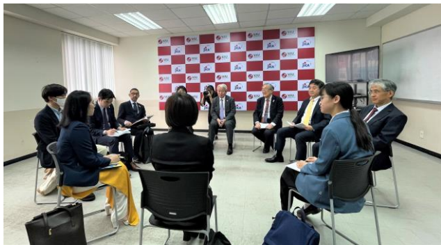
Chủ tịch JICA Tanaka Akihiko trao đổi với sinh viên chương trình Thạc sỹ của Đại học Việt Nhật

Trong phần trao đổi với sinh viên đang theo học chương trình Thạc sỹ tại trường, Chủ tịch Tanaka đã chia sẻ nhiều ý kiến dựa trên kiến thức và kinh nghiệm của ông trên cương vị chủ tịch JICA. Đối với một số câu hỏi của sinh viên liên quan đến tư duy quan trọng trong tình hình thế giới đang có nhiều biến động và thách thức, Chủ tịch Tanaka cho rằng việc đáp ứng nhu cầu cấp bách cũng rất cần thiết, tuy nhiên JICA luôn coi trọng mục tiêu hợp tác hiệu quả với tầm nhìn dài hạn.