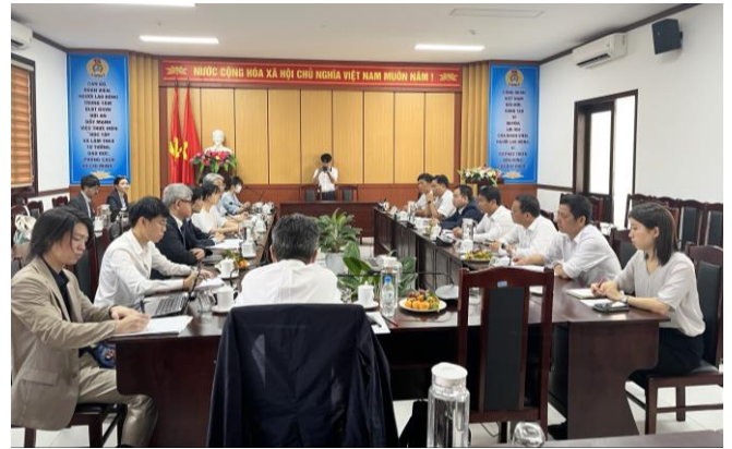
Các chuyên gia trao đổi với Trung tâm Quản lý Bảo tồn Di sản Văn hóa Hội An