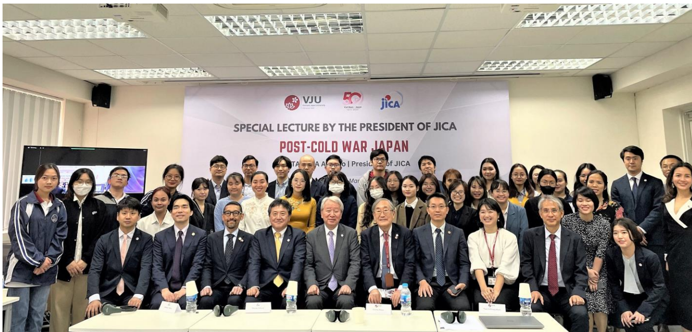
Chủ tịch JICA Tanaka Akihiko cùng các đại biểu tham dự Bài giảng đặc biệt chụp ảnh lưu niệm

Trong phần trao đổi với sinh viên đang theo học chương trình Thạc sỹ tại trường, Chủ tịch Tanaka đã chia sẻ nhiều ý kiến dựa trên kiến thức và kinh nghiệm của ông trên cương vị chủ tịch JICA. Đối với một số câu hỏi của sinh viên liên quan đến tư duy quan trọng trong tình hình thế giới đang có nhiều biến động và thách thức, Chủ tịch Tanaka cho rằng việc đáp ứng nhu cầu cấp bách cũng rất cần thiết, tuy nhiên JICA luôn coi trọng mục tiêu hợp tác hiệu quả với tầm nhìn dài hạn.