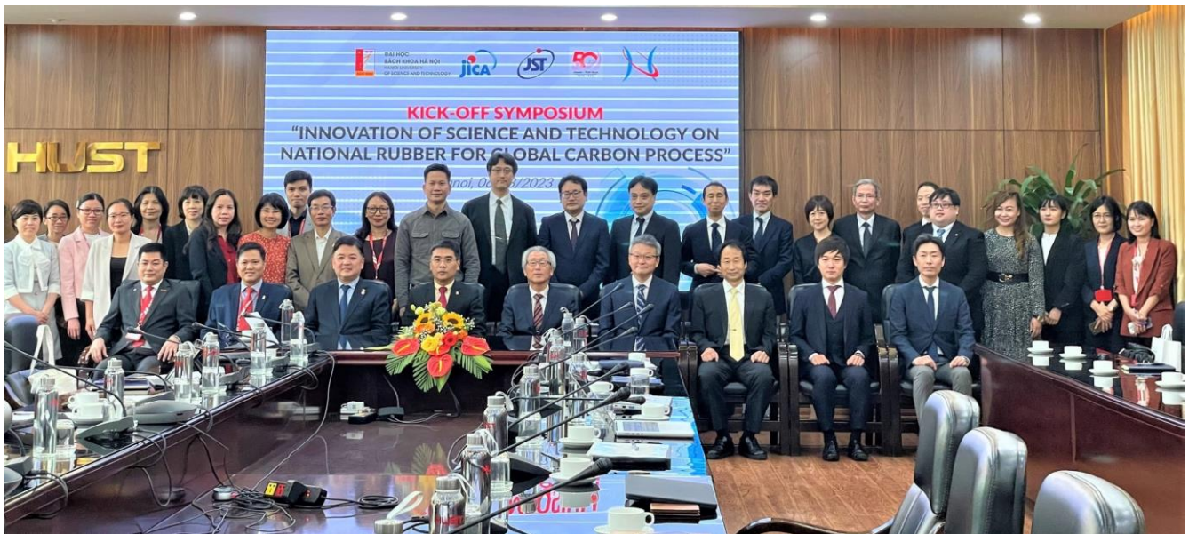
Các đại biểu chụp ảnh lưu niệm

https://www.jst.go.jp/.../english/kadai/r0303_vietnam.html