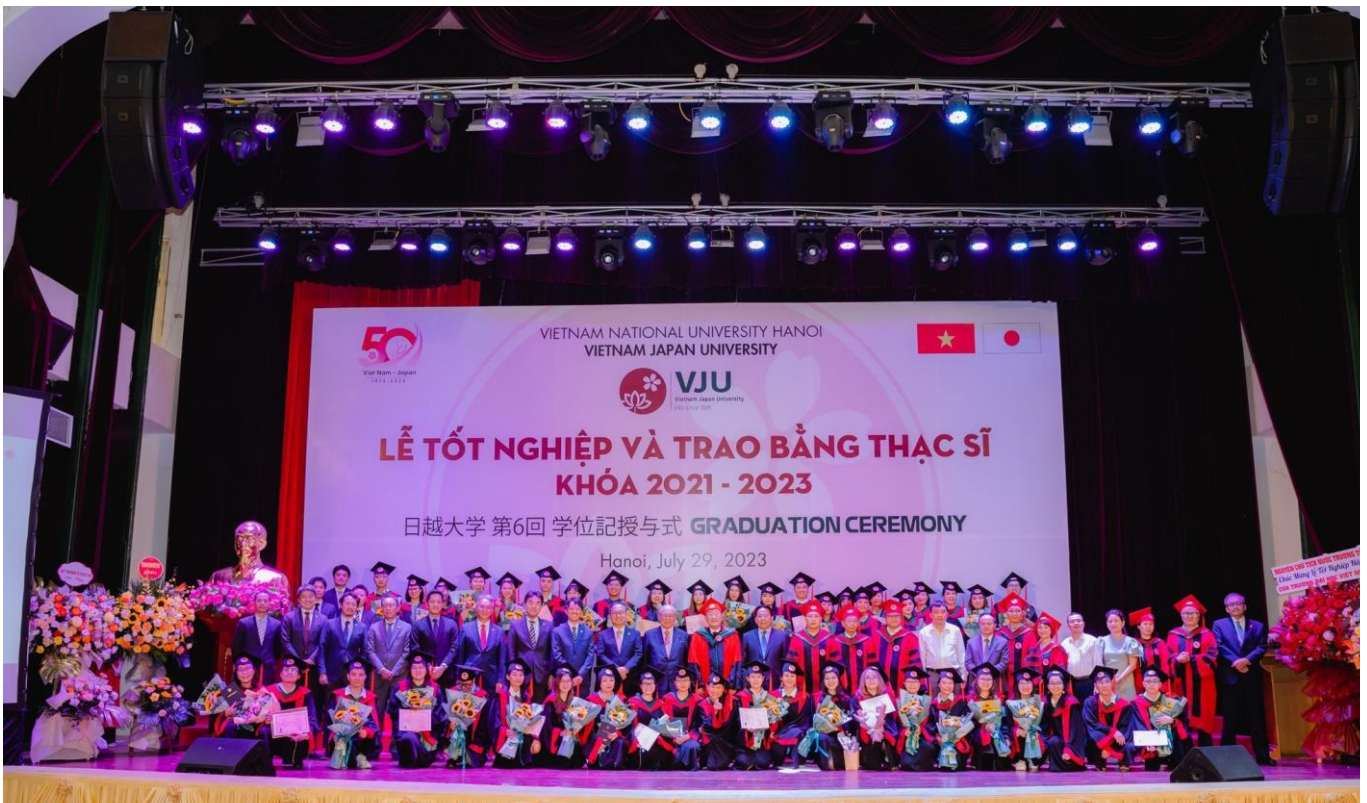
Lễ tốt nghiệp và trao bằng Thạc sĩ khóa 2021-2023

Ngày 29/7, trường Đại học Việt Nhật đã phối hợp với JICA tổ chức Lễ tốt nghiệp và trao bằng Thạc sĩ cho 41 học viên thuộc tám Chương trình đào tạo, bao gồm: Thạc sĩ Khu vực học, Thạc sĩ Quản trị kinh doanh, Thạc sĩ Chính sách công, Thạc sĩ Lãnh đạo toàn cầu, Thạc sĩ Công nghệ Nano, Thạc sĩ Kỹ thuật xây dựng, Thạc sĩ Kỹ thuật môi trường, Thạc sĩ Biến đổi khí hậu và phát triển.