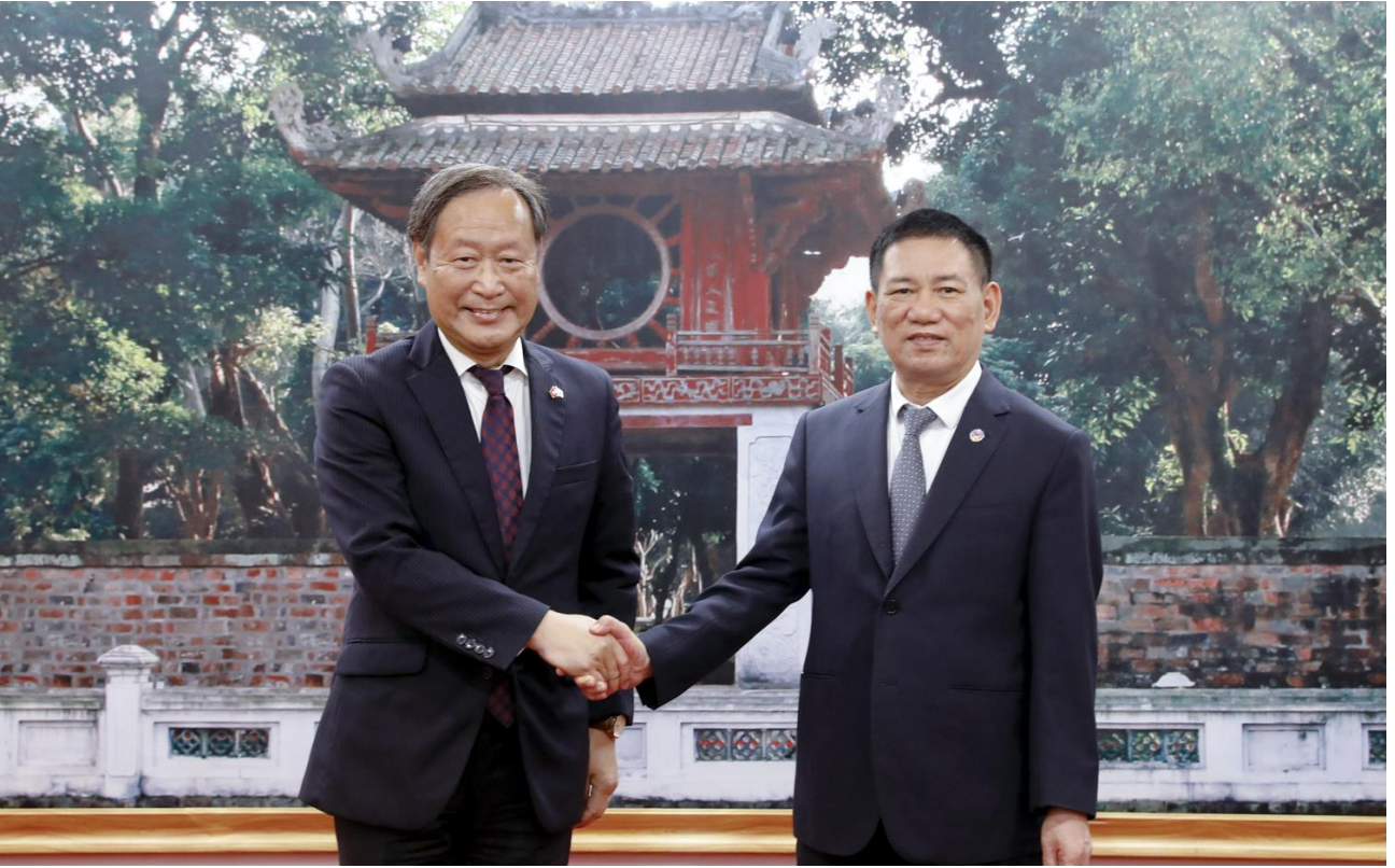
Bộ trưởng Bộ Tài chính Hồ Đức Phúc và Phó Chủ tịch Điều hành cấp cao JICA Yamada Junichi (trái)