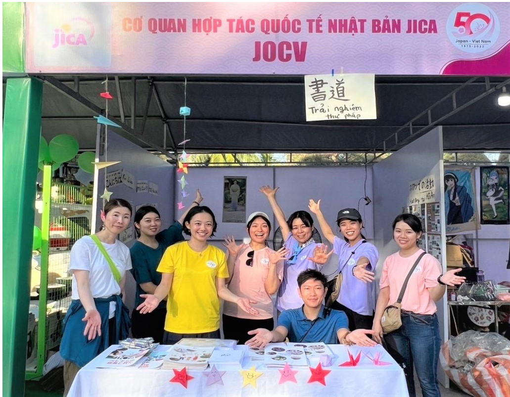
Các tình nguyện viên JICA đang làm việc tại Nghệ An, Thừa Thiên Huế, và Đà Nẵng làm náo nhiệt gian hàng

Từ ngày 13-16/7, Văn phòng JICA Việt Nam đã lần đầu mở gian hàng tại Lễ hội Việt Nam – Nhật Bản được tổ chức tại công viên Biển Đông, thành phố Đà Nẵng.