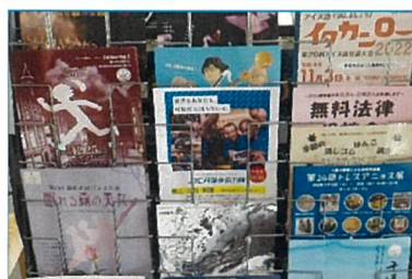
とかちプラザ南側入り口の、海外 協力隊募集広A4チラシ