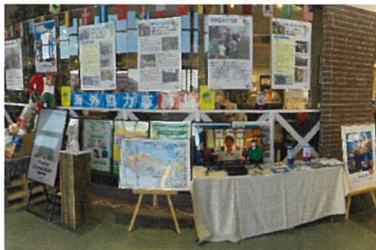
岡書イーストモール正面入り口 モニターを購入し、JICACMを放映