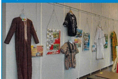
ドトールコーヒープラザ店壁面に 展示された世界の民族衣装とパネル