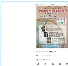
SNS配信で1000人近くの閲覧者が いた