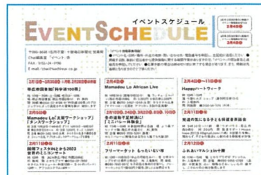
chaiイベントスケジュール コーナーに掲載