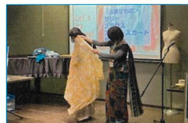
JICA職員が派遣先スリランカで着用 していたサリーの着付け実演