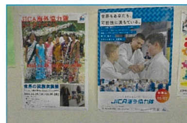
とかちプラザ1F情報センター壁面 B2版イベント告知と海外協力隊募集