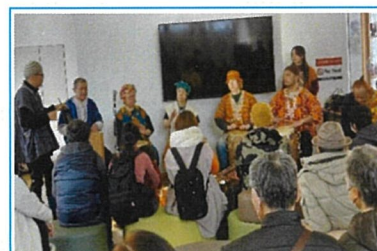
アフリカンドラムの演奏 人数カウントで65人以上。