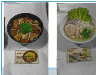
ラーメンとフォー