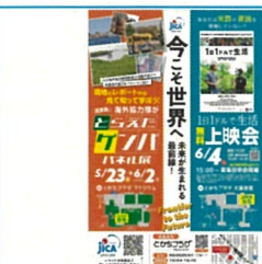
ポスターデザイン