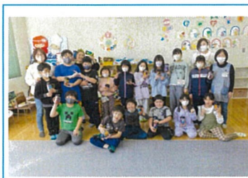
やまびこ児童館 イベント記念撮影