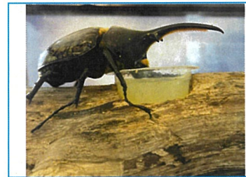
人気のヘラクレスオオカブト