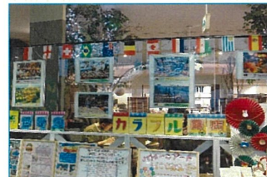
岡書イーストモール正面入り口 世界のカラフル露店パネル展示