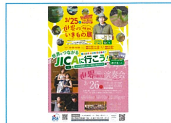
作成したポスターデザイン