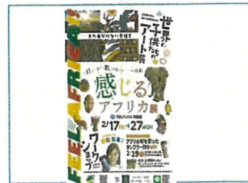
作成したポスターデザイン