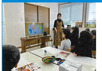
アフリカのお話会の風景