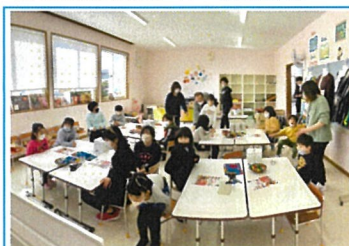
ふれあい児童館 会場風景