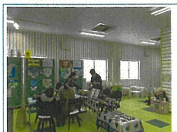
アフリカ布を使ったタンブラー作り 参加者