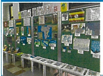
TSUTAYA木野店1Fにて実施 展示パネルはJICAからレンタル