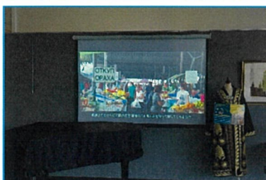
ドトールコーヒープラザ店内の大型 プロジェクターでJICACMを放映