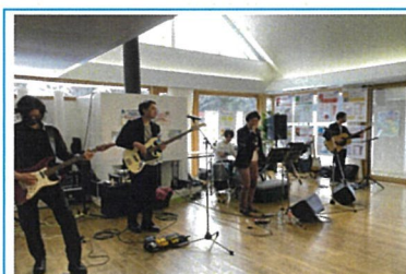
若年層から高齢者まで 昭和から令和までのJPOP曲の演奏