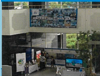
作製した超大型ポスター掲載