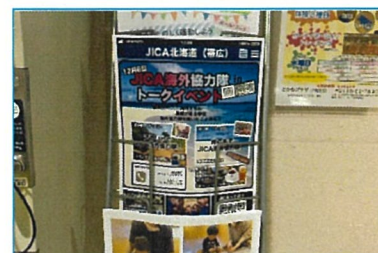
12/6 岡書イベント告知用A4チラシ とかちプラザ5階 軽運動室入り口