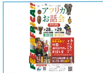
作成したポスターデザイン