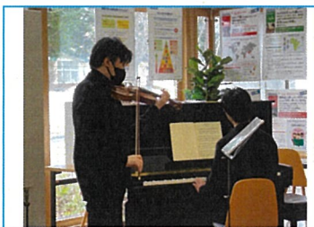
各国の曲や愛・平和・タンゴなどの曲を行った。