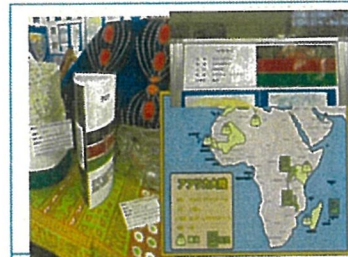
地図、国旗、JICAの活動が見れる QR付き三角柱POPなどを作成