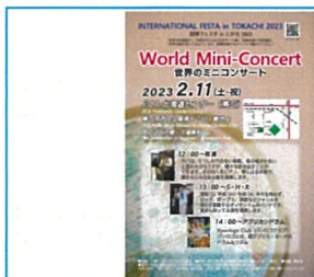
作成したポスターデザイン