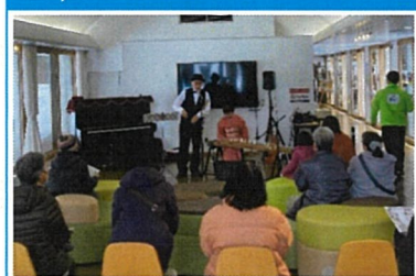
尺八、琴。子供が楽しめるよう 近年の人気曲の尺八verで演奏