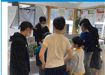
いきもの紹介 昆虫や爬虫類など 46種類のいきものを展示