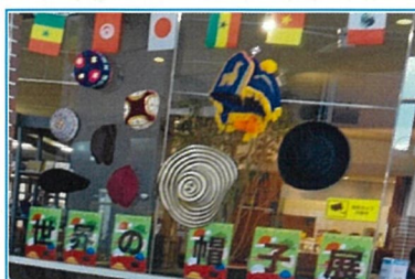
岡書イーストモール正面入り口 世界の帽子展