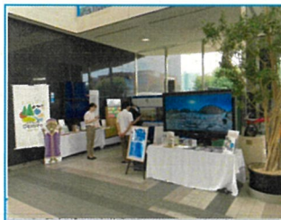
大型モニターでVR動画を放映