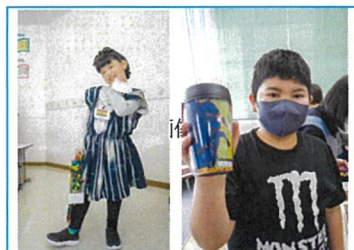
民族衣装の試着とタンブラー作り