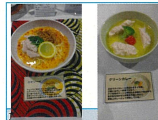
カオソーイとグリーンカレー