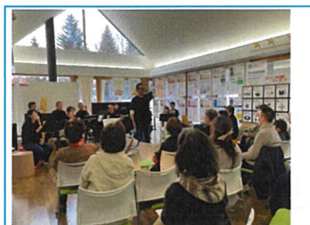
楽器の紹介や演奏者も知らないような楽器についてのクイズも行った