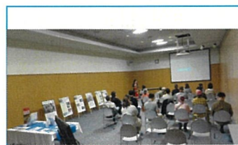
パンフレット・活動紹介パネル