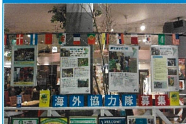
岡書イーストモール正面入り口 海外協力隊員の活動パネル展示