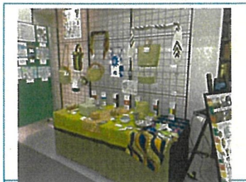
アフリカの雑貨コーナーを展示 食器や鞆など30点以上用意