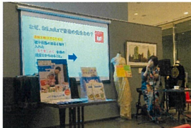
JICA職員による海外協力隊派遣先の スリランカに関するトークイベント