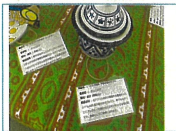
展示物ごとに説明書として キャプションを用意