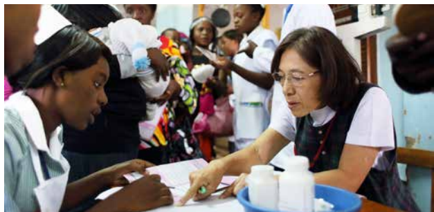
母子保健センターで乳幼児健診や実習生への指導を行うJICAボランティア（ザンビア）

母子保健、リプロダクティブ・ヘルス、感染症および非感染症疾患に特別に配慮しつつ、UHCの進展に向け、保健人材開発、保健サービス提供体制や財政基盤の強化などを、資金・技術協力を通じて支援する。