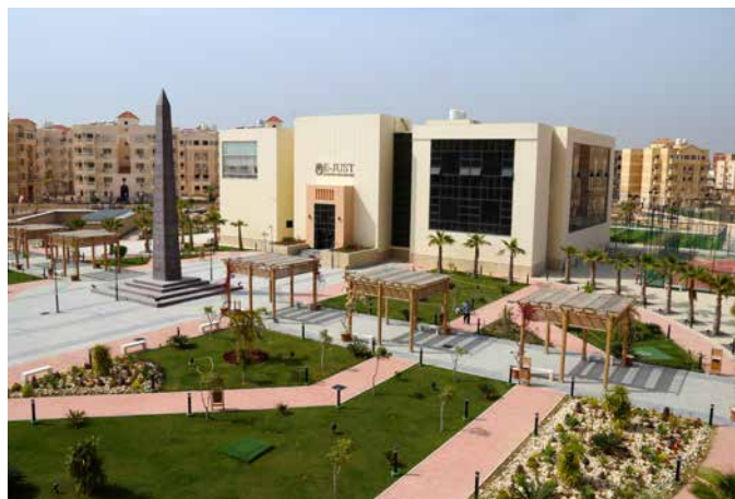
アレクサンドリア郊外に建つE-JUST (エジプト)