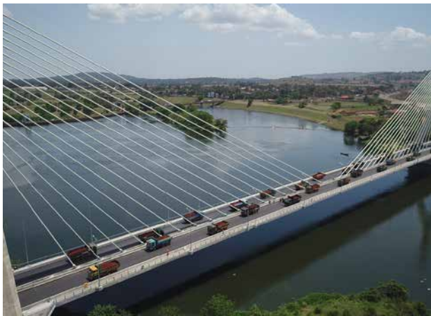
日本が協力し建設された北部回廊に架かるナイル川源流橋(ウガンダ)

「質の高いインフラ投資に関するG20原則」を踏まえた質の高いインフラ投資を官民で推進する。アフリカ大陸自由貿易圏(AfCFTA)設立協定の発効を踏まえ、アフリカ域内の連結性強化に向けたハード・ソフトのインフラ整備を行う。