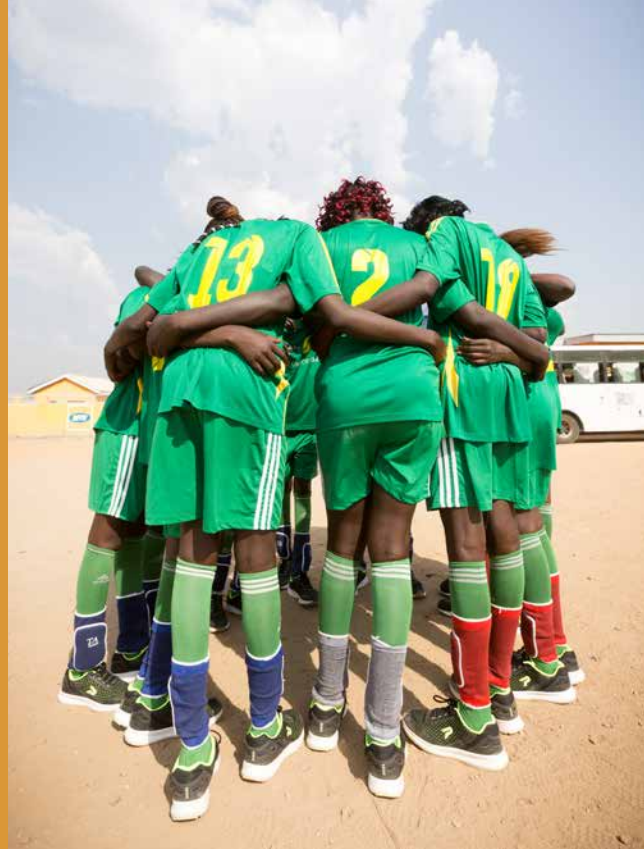
スポーツを通じた平和促進を目的に開催されている国民結束の日全国スポーツ大会(南スーダン)