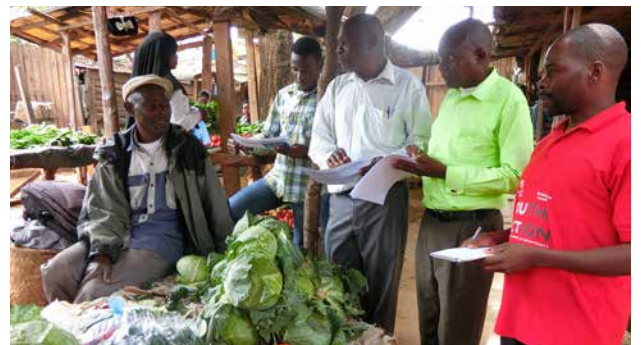
SHEPの研修で市場調査演習を行う農業普及員(マラウイ)

* Resilience, Industrialization, Competitiveness, Empowerment