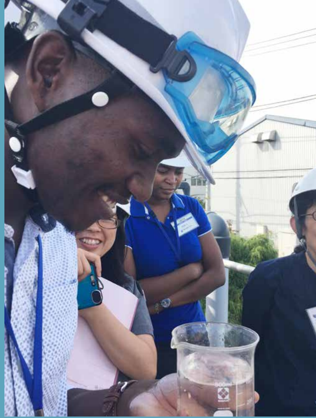
横浜市内の企業でインターンするABEイニシアティブ研修員