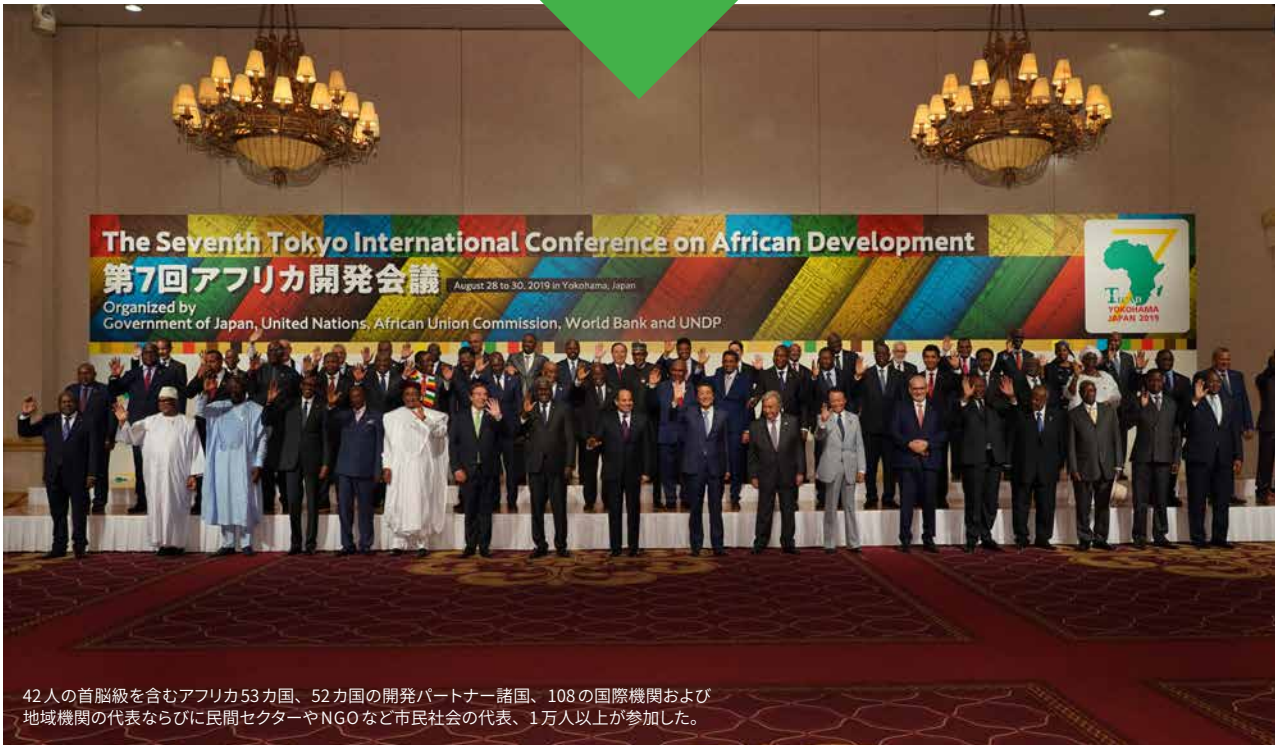
42人の首脳級を含むアフリカ53カ国、52カ国の開発パートナー諸国、108の国際機関および地域機関の代表ならびに民間セクターやNGOなど市民社会の代表、1万人以上が参加した。