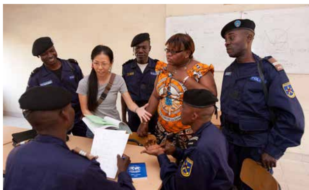
国家警察民主化研修の会場で教官らの習得度を確認するJICA担当者(コンゴ民主共和国)