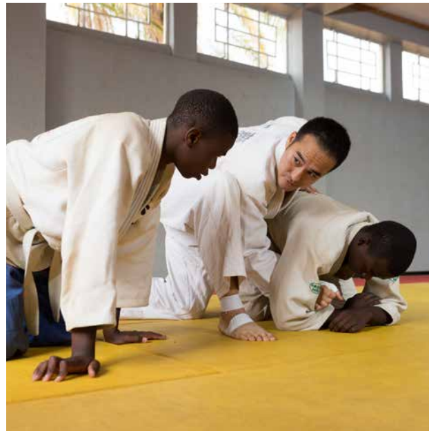
首都にあるスポーツセンターで柔道を指導する青年海外協力隊の隊員 (マラウイ) 写真：久野真一/JICA

アフリカ各国でのスポーツ指導、女性・障害者などへのスポーツ普及指導、スポーツを通じた平和と安定への貢献、東京オリンピック・パラリンピックのホストタウンとのマッチング・フォローなどを行う。