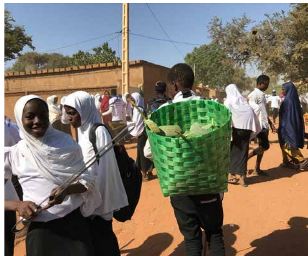
「きれいな街」を目指し首都の中学校で行われている清掃キャンペーン（ニジェール）

急速な都市化が進むアフリカの都市部を対象に、廃棄物管理、上下水道、都市計画の3分野で、ハード・ソフトのインフラ整備を支援し、持続可能な都市の発展に貢献する。