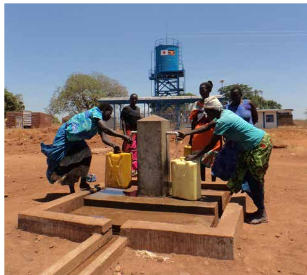
アチャリ地域国内避難民の再定住促進のため整備された公共水栓(ウガンダ)

人道と開発の連携を念頭に、国際機関などが実施する緊急・人道支援とも連携した自立支援、難民・避難民受け入れコミュニティ支援、若年雇用を通じた過激化防止などを行う。