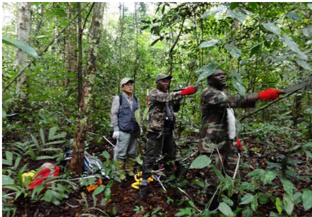
REDD+に資する国家森林資源インベントリーシステム強化プロジェクト (ガボン)