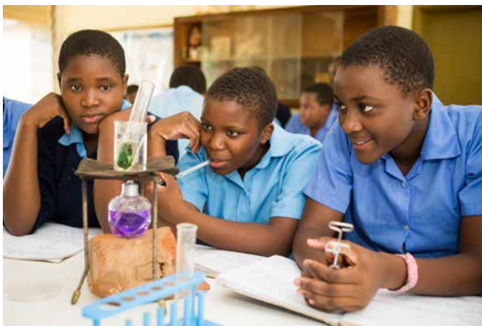
中等理数科現職教員再訓練プロジェクト (マラウイ)

教育開発の3本柱である「教育の質の向上」「教育アクセスの向上」「マネジメントの改善」を推進するため、理数科教育支援や学力試験の改善、学校建設、学校運営改善などの協力を拡充する。また、産業開発・科学技術の進展を見据え、その基礎としての教育環境の改善を推進する。