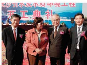
上) 新开设污水处理厂 下) 开工典礼