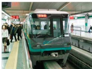
重庆轻轨铁路建设项目

在这些项目中，有很多诸如北京首都国际机场、北京地铁（1号线、13号线）、北京给排水项目（第九供水厂、高碑店污水处理厂）、上海浦东国际机场、重庆轻轨、武汉长江第二大桥等与百姓生活密切相关的日元贷款项目。另外，通过无偿资金援助与技术合作实施了一批以北京中日友好医院为代表的直接关系到提高中国人民生活水平的项目。