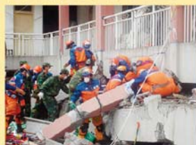
日本国际紧急援助队救援小组的救援场面

2008年5月12日震中位于四川省汶川县的四川大地震发生后,日本政府立刻向中国政府表示已做好了随时救援的准备。5月17日,日本国际紧急援助队,救援队作为第一支国外救援队抵达中国,并展开相关救援工作。此后,日本政府又继续向受灾群众进行了紧急物资援助、派遣医疗队、追加物资供给等一系列救援工作。对于这些来自日本方面的救援活动中国国内也进行了广泛的报道。