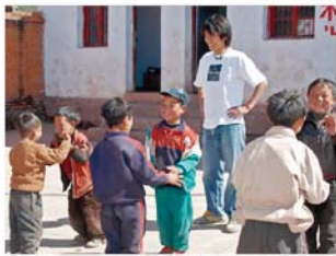
在四川省凉山州工作的青年海外协力队员 (日语教师)

实行改革开放政策的中国的进一步稳定与发展，日中两国友好合作关系的加强，对于亚洲、太平洋地区乃至全世界的稳定与发展都是极其重要的。