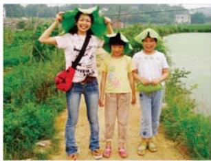
在湖南省开展工作的青年海外协力队员 (幼儿园教师)

2007年12月，随着日中两国政府签署了最后一批日元贷款项目的政府换文，日本对华日元贷款划上了一个圆满的句号。这一经济合作内容的变化，是中国通过自身努力，实现了经济发展的结果，在此过程中，令人欣慰的是，我国援助的有效运用为中国的经济发展和日中合作发挥了积极作用。而且目前，中国正积极致力于对其他发展中国家提供援助，今后日中双方也可在共同合作向亚洲、非洲等发展中国家提供援助方面展开对话。