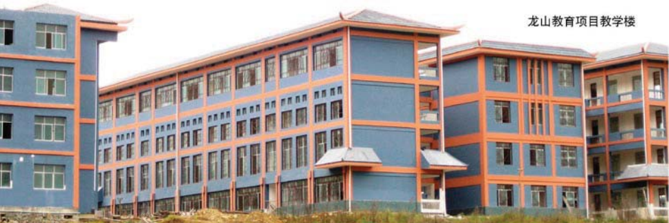
龙山教育项目教学楼

我们衷心地期待通过项目的实施不仅能够改善项目对象地区的环境和当地居民的生活条件，还能够增进中日两国人民的相互理解，架起两国间友谊的桥梁。