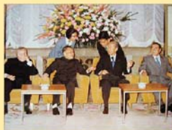
1978年福田赳夫首相(当时)会见到访的邓小平副总理(当时)。1979年日本开始对华经济合作

“世界各国都认为应当祝福贵国(中国)的现代化政策，这完全是因为这一政策直接关系到国际协调的核心问题，并且更加富强的中国的出现可望使世界更加美好；我国之所以大力推行对中国的现代化进行合作的方针，不仅有我国自己的考虑，而且也是由于有这种全世界的期待在做后盾。”