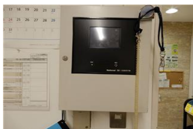
1階フロント 副受信機