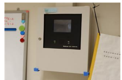
地階監視室 副受信機