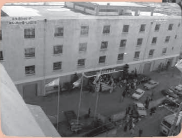
社行式を終えて海外移住センターから旅立つ人々

JICA横浜では、海外移住事業団時代から形を変えつつ続く移住者・日系人関連業務を引き継ぎ、現在も日系社会研修員の入受れなどを行っています。日本人の海外移住の歴史と貢献、現在の日系社会の姿を日本国内で伝え続けていくことも、大きな使命のひとつです。