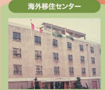
海外移住センター