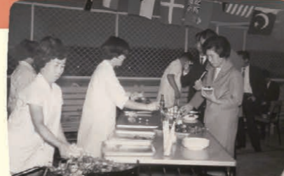
南米式BBQパーティーも開催されていた