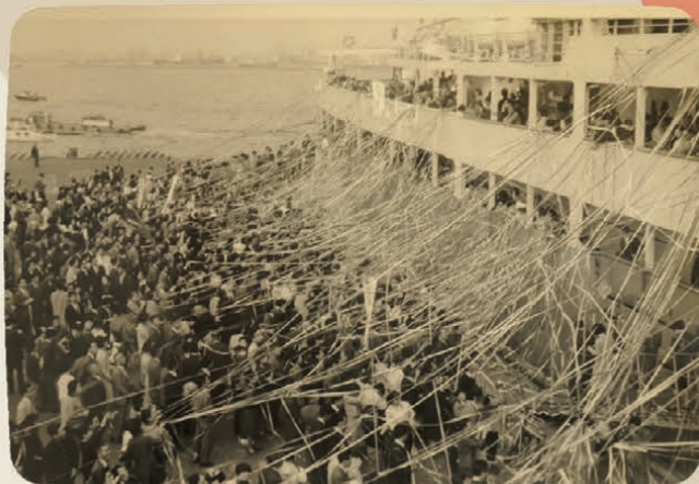
出航する移民船を見送る人々

戦前・戦後を通じて、日本は国の政策として海外移住を奨励し、たくさんの移住者を送り出してきました。その中で、戦後の移住政策を一元的に実施するために設立された海外移住事業団が、現在のJICAを形作るルーツのひとつなのです。JICAと海外移住には、長い歴史と関係性があるのです。