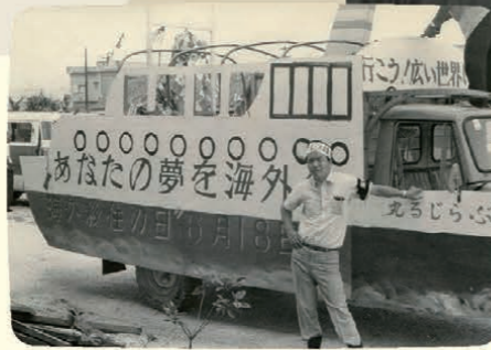
海外移住に関する知識普及や広報活動が盛んに行われていた

JICAの前身のひとつである海外移住事業団では、海外移住に関する広報や知識の普及、移住希望者の相談、移住のあっせん、移住前の語学訓練や移住地での生活に対する講習などを行っていました。また、移住者が移住先で安定した生活を送れるように、現地では移住地の整備や教育・医療の支援、事業資金の融資、営業指導なども行っていました。