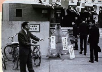
地域の人々を招いて開催された南米イベント

長い船旅に備えるために移民船の船内に似せた造りになっていた趣のある建物は、古びてはいたものの、移住者やその子弟、移住地で活動するボランティアたちから長い間親しまれてきました。JICA横浜ができる際に民間に売却されて、現在その跡地はマンションになっています。