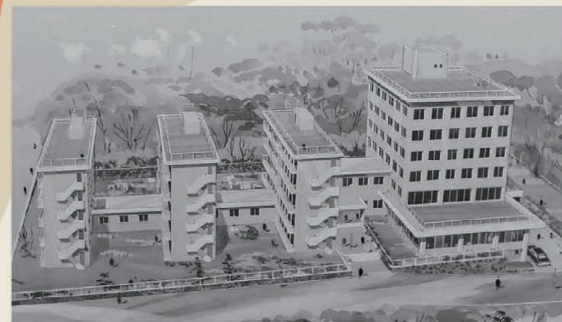
1966年頃に描かれた「海外日系人センター」の完成予想図。日本人海外移住資料館や500名収容可能な「ハイオン・ホール」、来日する日系人や日系留學生のための宿泊棟を備えた施設の建設計画が具体的に進められていたことがわかる。(出典「海外日系人大会60周年の歩み」・公益財団法人海外日系人協会発行)

移住先の国々で、日本人移民はさまざまな苦勞を乗り越え、子孫が生まれてその国に根付いていきました。こうした人々が日系人と呼ばれることになりました。