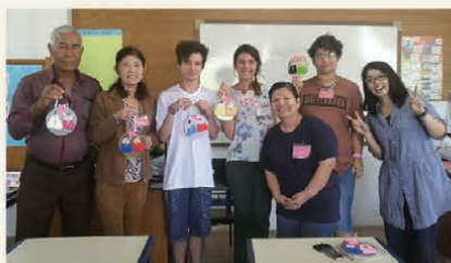
ブラジルの日本語学校へ派遣された日系社会青年海外協力隊員(右)の活動の様子(日本文化の授業)

中南米の日系社会で、自分の持っている技術や経験を生かしたいという方を、現地へ派遣する事業。日本語教育、スポーツ、家畜飼育、経営管理、ソーシャルワーカー、保健師などの分野で、原則2年間、日系社会の人々と共に生活・協働しながら地域の発展のために活動しています。