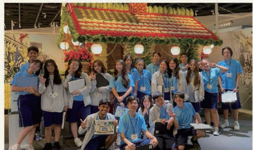
中学生招へいプログラム(移住学習の一環で資料館を見学)

日本の中学生～大学生に相当する年齢の日系人子弟を日本に招いて行う研修。体験入学やホームステイなどを通して、日本の文化・社会への理解を深め、自分たちのルーツを学ぶことで、日系人としてのアイデンティティを再認識し、次世代を担う人材として育成することを目的としています。