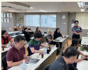
資源の再生やアップサイクルへの取り組みについて学ぶ研修員(「持続可能な日系団体運営管理」コース)

中南米地域の日系社会から、日本との連携にリーダー的な役割を果たす人材を日本に招いて実施する研修。日本語・日本文化の継承教育や、高齢者福祉、農業・医療など、日本各地でさまざまな分野の研修を実施しています。