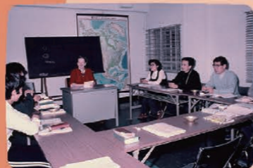
海外移住センターでの語学研修

戦前、横浜港の周辺には、出発前の移民が準備期間を過ごした移民宿が多くありました。戦後は、1956(昭和31)年に外務省が設立した横浜移住斡旋所を1964(昭和39)年に海外移住事業団が引き継ぎ、横浜移住センター(1971年に海外移住センターに改称)が誕生しました。