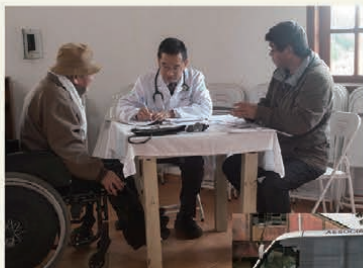
病院や診療所のない移住地を訪問する巡回診療