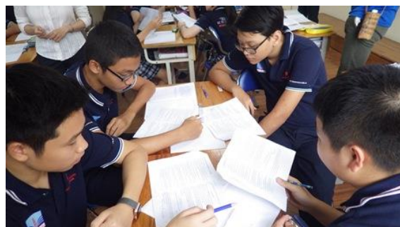
ベトナムでの国語の授業風景