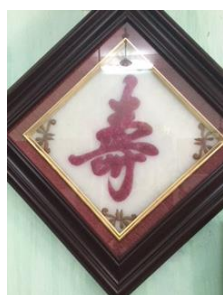
ベトナム語表記と漢字の砂絵