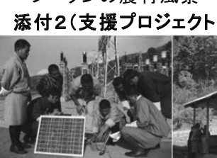
地方電化促進プロジェクト