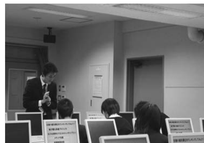
優先順位を話し合う生徒たち

次に、提示された支援プロジェクトについてグループで優先順位を決定した。4つのグループは、地方電化促進プロジェクトを、2つのグループは、職業訓練校の質的強化プロジェクトを最も必要な支援であると考えた。