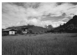
ブータンの農村風景