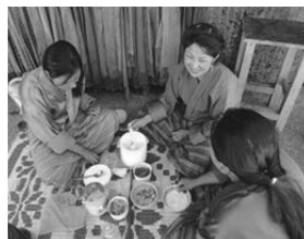
ブータンの人々の生活