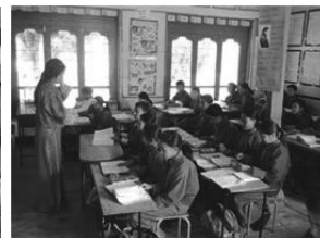
学校に通う子どもたち