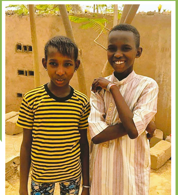
ムバイさん(右)と、一緒に学校に通う妹

学校に通うために妹と2人で市内の親戚のおばさんの家で生活しています。家族はここから40キロほど離れた村に住んでいます。村には、両親やきょうだい、親戚を合わせて30人以上の家族がいます。