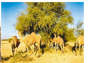
野原に放牧されたラクダ