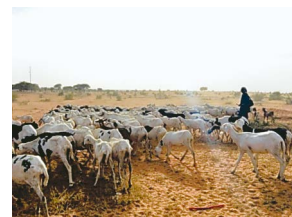
草を求めて移動する羊と遊牧民

ると、街では放し飼いにされたヤギや荷物を運ぶ馬、野原では草を求めて移動する牛やラクダを見ることが出来ます。日本で生活するよりも家畜を近くで感じられます。