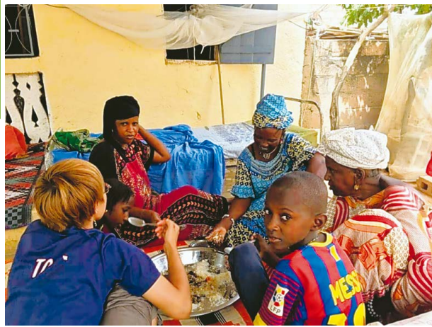
おばさんの家で食べるお昼ごはん

「ヤッサ」と言って、白ごはんの上にちょっぴりスパイシーなタマネギソースをかけたごはんが好きです。おばさんの作るヤッサはとてもおいしいです。