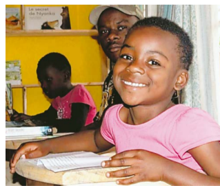
地域に初めてできた図書館で絵本を開く女の子

ルワンダでは「ありがとう」といってお礼を言うことが「こちらこそ」と返ってきません。ご飯を分けてもらった時、道を教えてもらった時、家まで送ってもらった時、荷物を支えてもらった時、壊れた水道を直してもらった時……。どんなに私だけが一方的に助けてもらった場合でも、お礼を言うこと