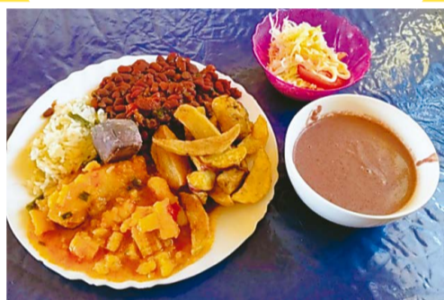
豪華な食事の時は、大皿から自分が食べる分を取り分けます。おかわりはなしです