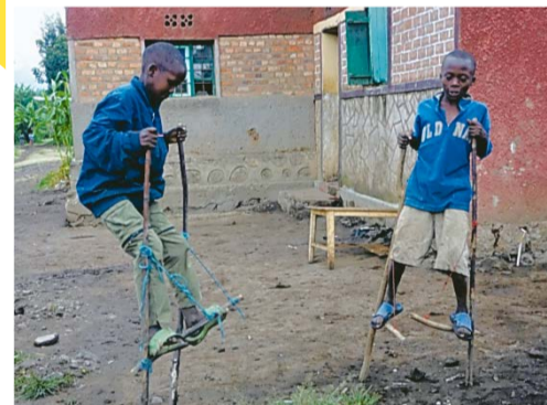
木の枝で作った竹馬で遊びます

日本はお金持ちで強い国です。中国の近くにあつてサッカーも強いと聞きました。僕もいつか日本に行つてみたいです。