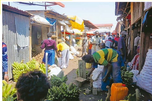
食事の材料を買う市場。緑色のバナナやジャガイモが見えます

ジャガイモをよく食べます。ふかしたジャガイモも好きですが、特別な日にはフライドポテトになるので、とてもうれしいです。ジャガイモの他には、お米や豆や甘くないバナナも食べます。