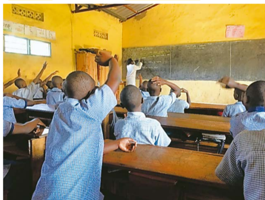
小学校の授業中。男女とも坊主頭です

昨日のテストが良くできていたか気になります。テストは好きではないけれど、良い点を取ってお母さんが喜ぶとうれいんです。進級できるとういな。