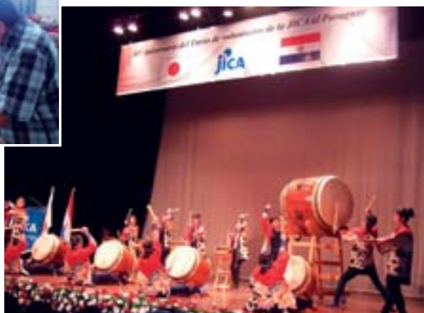
▼JICAパラグアイ30周年記念式典で、現地の2世、3世の方々和太鼓の演奏