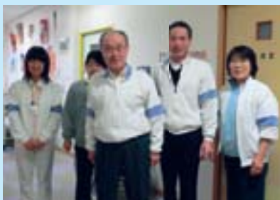
▲いつもボランティアを明るく受け入れて下さるエーデルこまがねの職員の皆さん

所外活動の受け入れを始めて3年が経ちました。利用者の方々は協力隊員を孫のように思っていて、毎回訪れるのを楽しみにしています。最初は何をしていたか分からず、戸惑っているボランティアも、時間をかけるうちに笑顔で利用者