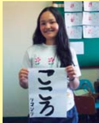
習字の授業の一コマ。 日本文化の継承も日系社会ボランティアの重要なテーマです

ブラジルの日本語学校では、習字や太鼓など日本文化の授業も盛んに行われています。特に太鼓は人気があり全国大会も開催されるなど、たくさんの子どもたちが練習に励んでいます。