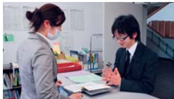
▲期間中は訓練所スタッフ(左)もボランティアに 対し外国語で対応します

中の言語だけでコミュニケーションを行っています。伝えられないもどかしさや、伝わったときの感動を味わい、これから出発する派遣国での生活を想像しながら、訓練生は日々の語学学習に取り組んでいます。