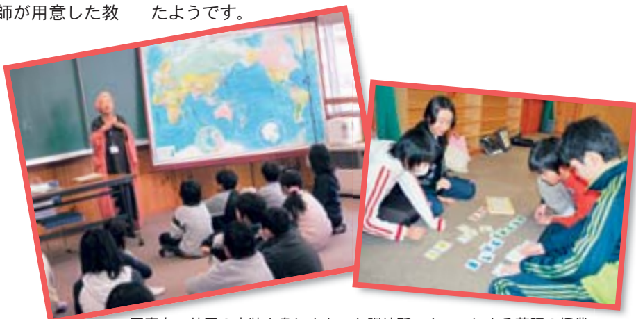
写真左：外国の衣装を身にまとった訓練所スタッフによる英語の授業 右：オリジナル教材を使い、「色」を表す単語のスペルを勉強中

授業では欧米諸国だけでなく、アジアやアフリカでも多くの国が英語を使うことを知ることができました。これによって英語を学ぶことで世界中の人とつながることができる実感したようです。また識字率が低い国々では文字を読めないことは不便であるだけでなく、命の危険を招くこともある(例えば地雷地帯の警告など)という話を聞き、言葉や文字を学ぶ大切さとありがたさが子どもの心にも届いたようです。