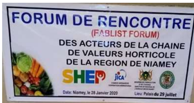
24日(金)午後1時にDRAがバンドロールを注文してないことが判明し、急いで注文した