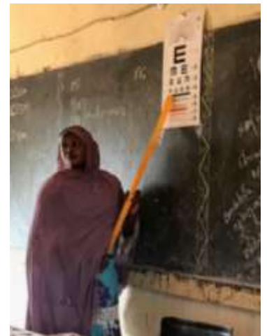
研修3日目。実際に学校で視力検査を試みる先生。

今回は、そのメインの活動でもある、ニアメ市内3校における「児童の視力に障害・不調の予防」の教員向け研修に、NSハマさんと視察してきました。研修初日、研修会場を覗くと、すでに対象校の教員(ほとんどが女性!)がすでに着席し、研修の開始を待ちわびていました。開会の挨拶は、保健省幹部から述べ