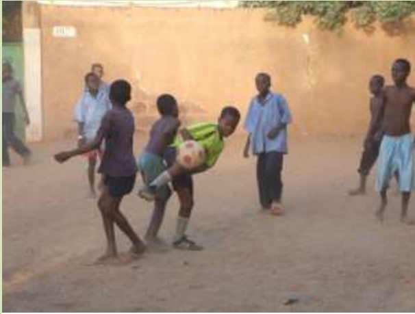
ニアメ市内のサッカー少年