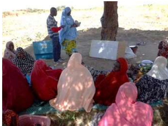
課題分析からアクションプランを作成するの農家

SHEP アプローチでは、農家と園芸産業関係者(野菜買取り業者、野菜種子・苗販売業者、農業資材業者、マイクロファイナンス機関など)が、「ビ