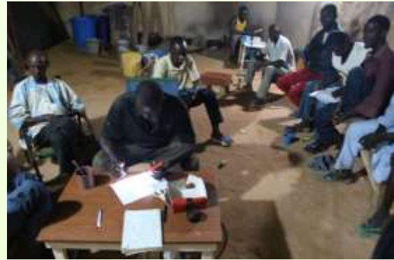
5つの数字を考える姿は、真剣そのものである。

などと言ったのち、ため息がもれる。バイクの運転手はすでに、翌日の出走表をPMUより持ち帰っている。男性たちは出走表を入手し、ふたたび夜に悩みつづけ、5つの数字をひねり出すのである。