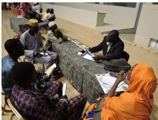
種子業者に質問する農家。右手の女性が普及員で、普及員は、農家がコミュニケーション計画に沿って質問できるようにサポート役に徹します

お見合いフォーラムの会場は、Palais du 29 juillet(通称Stade)。ニジェールに長くいる日本人の方は聞いたことがあると思いますが、大きな室内運動施設です。バスケットボールコートを貸切りました。この模様は、ニジェールのナショナルテレビ Tele Sahel の20時半からのニュースで放送されま