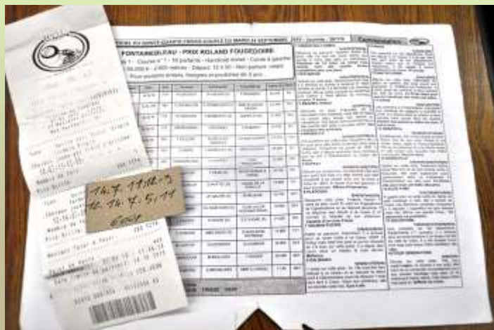
A4用紙の出走表と紙きれ、そして購入された5連複の馬券

小さな金額が当たったとき、男性はうれしくなって周囲に自慢するが、大金が当たったときには黙りこくりに、けって周囲には言わないという。しかし、男性が理由もなく、急に市場で屋根用のトタンや中古のバイク、ウシなどを購入すると、競馬で的中したことを周囲は疑うのだという。村で、かつとも大きい払戻金は1,676,000フランと言われる。日本円にすると、約33万5000円である。20円が33万5000円になったのだから、その喜びは半端なかったようである。この男性は食料と中古バイクを購入し、父母の生活支援をし、トタン屋根の家をつくり、しばらくして第2夫人を迎え入れた。本人はこのときの快感を忘れることができず、毎晩、出走表をにらみ、500~1000フランを賭けつづけている。「賭け事にはまるのは、ばかだと」と一蹴する人も少なくないが、近隣の友人の成功談を聞くと、男性たちはじっとしていられない。果たして、5つの数字は明日の成功に結びつくのだろうか。