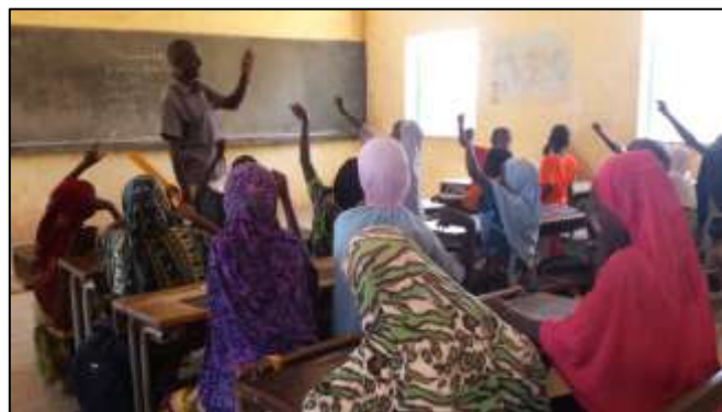
写真左：授業の様子—女の子も男の子も積極的に手を挙げてます。

そして今、プロジェクトでは、初等教育での成果を受け、この全国的なコミュニティ参加の就学促進ムーブメントを中等教育に広げようと取り組みを開始しました。今年 2~3 月には、再び UNICEF との連携により、 初等・中等両教育分野にまたがる第 2 回全国 8 州初等・中等教育フォーラム を開催予定です。今回の第 1 回州教育フォーラムを通して小学校に入った子どもたちや、初等教育を経て中学校に入った子どもたちが、ドロップアウトすることなく、きちんと継続して教育を受けられるように、全国に広がる初等 CGDES と中等 COGES のネットワークを駆使して、初等教育・中等教育の現場アクターによるシナジー活動を生み出していきます。