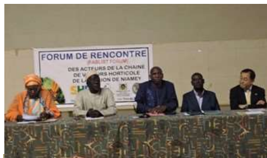
JICA ニジェール支所小畑支所長に挨拶頂きました