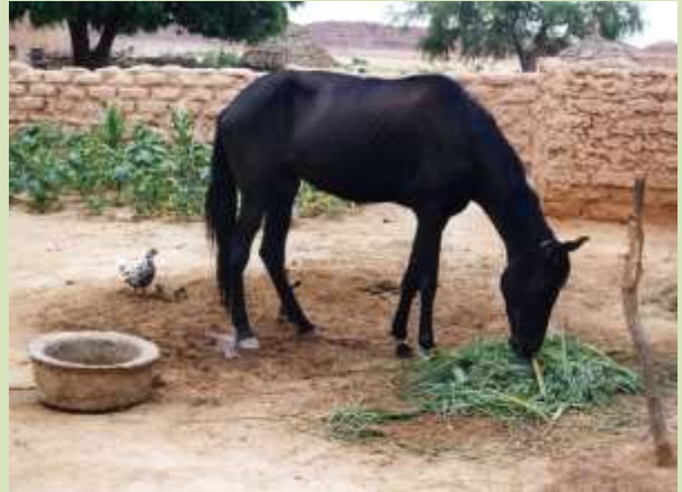
わたしが寝泊まりしていた村長宅の敷地にはメス・ウマがいた。

行った。2005年ころだったろうか、村長宅では家族の食料が不足し、多額の現金が必要となり、ウマは売りに出された。それ以来、村長宅だけでなく、村にはウマはいなくなってしまった。いつしかウマの役目はバイクに変わり、校長先生はバイクで小学校へ通うようになり、村長は年老いて、歩くことができず、遠出できなくなった。