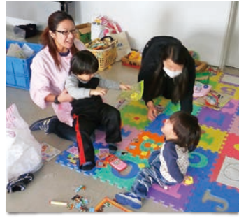
～ キッズルームの様子 ～

事業仕分けの翌年、更なるピンチが訓練所を襲いました。2011年3月11日は、平成22年度第4次隊の修了式のその日でした。無事修了証を手にした協力隊員たちは、それぞれの自宅へ向け帰路についたところで被災しました。