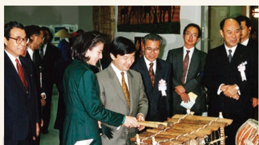
～ 広報展示室の楽器を演奏されました ～

1965年に青年海外協力隊の派遣事業が始まって以来、天皇皇后両陛下(当時は皇太子同妃両殿下)は、協力隊事業に強い関心をお寄せになっており、初代隊員より、出発前に直接お目にかかる機会をいただき、激励のお言葉を賜っています。