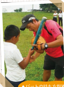
▲バットの持ち方指導中