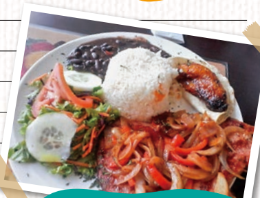
▲一般的なコスタリカ料理。ご飯、肉、豆、サラタ、プラタノ(バナナのようなもの)が一皿に乗っている。