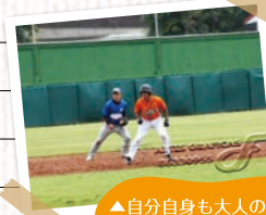
▲自分自身も大人のリーグ戦でプレイ中