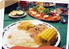
▲コスタリカはキリスト教の国。クリスマスのごちそう。