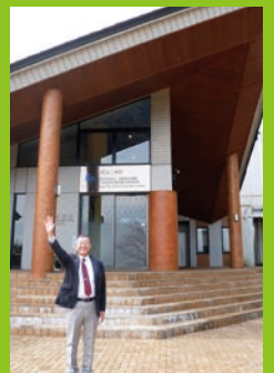
20周年を迎える訓練所にて

一番はじめの候補生たちに「頑張って!」と言おうと思っていたんです。そのときに、スタッフの方に「訓練生はパンパンに頑張っているのだから、頑張ってと言われると余計に頑張ってしまうので」という話をされたことがあります。そのときに、既に頑張っている人に頑張れというのは酷なことなのだと思います。だから、「自分のあるがまを出してきてください」ということだけを伝えたいと思います。あるがままの自分を出して活躍してください。