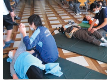
～ 協力隊員によるマッサージ ～

こうして二本松訓練所では、避難所を閉じる2011年の7月末までの間に最大で453名を受けられました。(定員は204名)