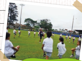
▲小学生の子供たちと準備体操

コスタリカでの一番のスポーツはサッカーです。小学校の体育でもサッカーばかり…なんてこともめずらしくありません。そこでまずは野球を知ってもらうために小学校を巡回したり、野球の大会を企画したりしています。そして野球が好きな子供たちのために学校とは別にリーグ戦があり、その子供たちを指導したり、リーグ戦がない時期は国際大会参加のためチームを結成し指導したりしています。またスポーツの普及には指導者の育成も大切です。大人でも野球経験者もそうでない人にも興味を持ってもらうために日本の野球指導書をスペイン語に翻訳する活動をしています。