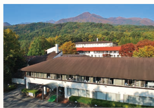
～ 日本アルプスに囲まれた自然豊かな駒ヶ根訓練所 ～

青年海外協力隊訓練所のある都市同士として、交流を深めてきた長野県駒ヶ根市と二本松市が友好都市協定を締結しました。また、5年後の2005年には「災害時の相互応援に関する協定」を締結しており、2011年の東日本大震災発生時には二本松市は駒ヶ根市より多大なる支援を頂きました。震災直後には給水タンク車の派遣をはじめ、毛布や食料・衣類等を提供していただき、避難所をサポートのため駒ヶ根市の職員・保健師の人的支援をいただきました。また、震災後には、放射線を心配し外遊びを控えている子どもたちのリフレッシュのため、二本松の子どもたちが駒ヶ根市に招待され思いっきり遊ぶことができました。