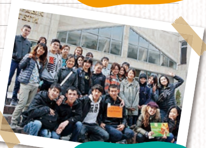
▲学生とゴミ拾いのボランティアをしました。

早いもので、私の任期もあと半年。残りの時間も学生に「楽しい」と感じてもらえるような取り組みをしかけて行きたいと思っています！