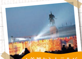
▲首都セントラルパークのお祭りの夜の様子。「マナス」という英雄の像があります。

私は今、首都ビシケクにある大学で、日本語教師をしています。中央アジアの他の国に比べ、キルギスには日系企業は少なく、就職に結びつきにくいこともあり、「日本フーム」の頃に比べ、日本語の学習者は減っていますが、それでも日本文化に興味を持ち、日本へ留学する夢を持つ学生と日々切磋琢磨しております。日本の大学とスカイプで交流