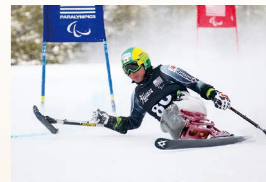
同じく「ノルアムカップ」での一枚。大回転の様子。