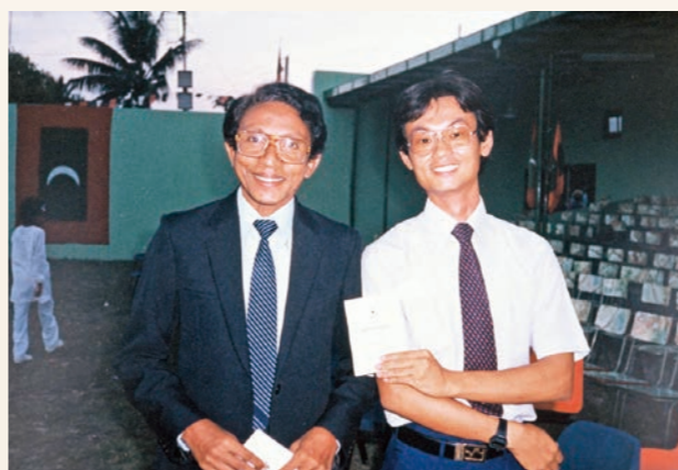
青年海外協力隊員だった頃の北野所長(右)。モルディブオリンピック委員会会長さんとの一枚。