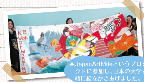
▲Japan Art Mileというプロジェクトに参加し、日本の大学と一緒に絵をかきあげました。