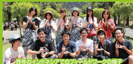
昨年のインドネシアでのフィールドワークの様子

リーダーではなくファシリテーターであってほしいです。夢を持ってそれにむかって努力し、自分で道を切り拓いてください。