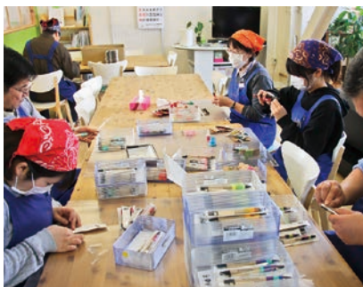
委託を受けて「つながりのボールペン」作成している

そして社会との付き合い、開かれた社会福祉事業所を目指すためには、やはりJICA二本松の候補者のように外部からボランティアで入ってきてもらうのは必要だと考えています。