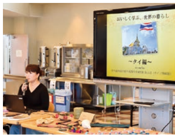
タイランチ～経験者の体験談を聞きながら～