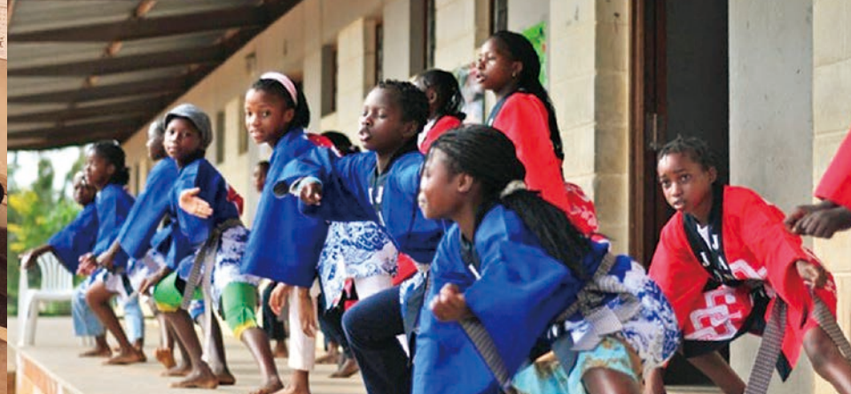
帰国後、ラジオでJICAボランティアの活動について話してくれました。