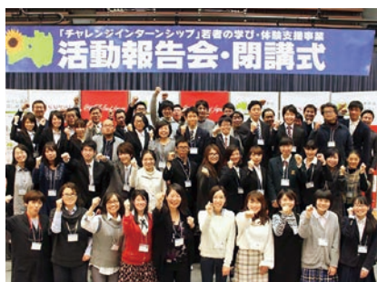
ユースのインターンシップ受け入れも実施している