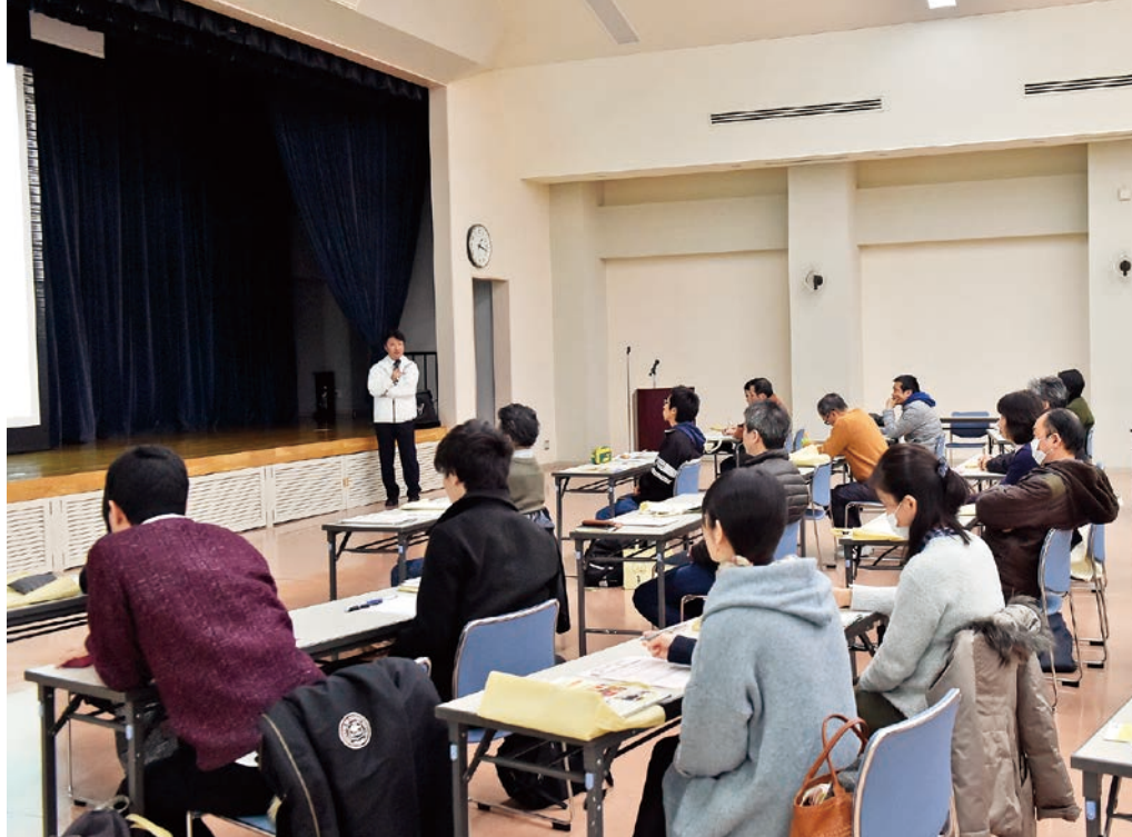
訓練所長による熱血講座