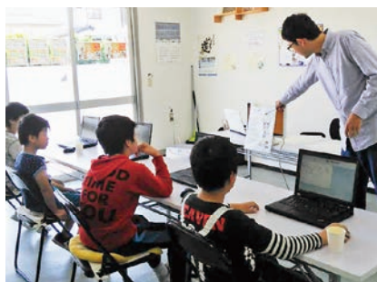
子供向け講座の様子

また要請内容にあった日本祭りや運動会などのイベントも企画しました。モザンビークの子どもたちが活躍できる場所を作り、そこで楽しむことや喜んで生まれた感情は将来きっと役に立つと感じました。