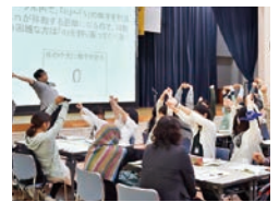
昨年度「オープニングセッション」