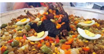
セネガルの主食は米。 炊き込み御飯のようなものを 大皿でみんなで食べる。