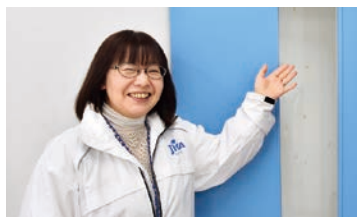
進路相談カウンセラーによる個別相談室

3月31日(金)から5月10日(水)までJICAボランティア春募集を行いました。福島県ではJICA二本松訓練所で4月2日(日)に「1日体験入隊～入門編～」、30日(日)に「1日体験入隊～合格編～」を実施しました。