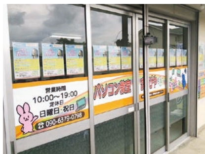
パソコン教室 まなびや

「パソコン教室 まなびや」は今年で2年目になりますが、パソコンに関する講座以外にも様々なことを行っています。東日本大震災地域に住んでいる方へのパソコンの技術指導や地域活性化への取り組み、就職支援活動の一つとして女性の就労支援活動に関するセミナーの開催等、様々な企画を立ち上げました。また青年海外協力隊員として海外で活動もしていたので、今後も海外とつながりを持てる活動をしていきたいです。