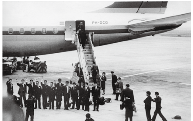
Le premier contingent de volontaires prêts à partir vers leur affectation (1965)

Depuis la première mission envoyée au Laos en 1965, plus de 54.000 volontaires de la JICA ont travaillé de concert avec la population locale de 98 pays et régions. Comme le résume leur mot d'ordre « ensemble avec la population locale », les volontaires de la JICA vivent et travaillent au niveau local, parlant la même langue que la population locale et menant des activités centrées sur la promotion de l'autonomie vers des transformations durables.