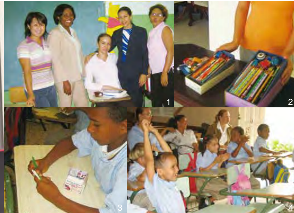
1.2年間、共に授業づくりを行ってきたカウンターパート達(校長、教頭、教務、担任) 2.帰国後、日本の中学校での寄付(鉛筆や消しゴム)を学校へ届ける 3.カウンターパートが考えた教具(アメの棒を数え棒に、牛乳パックをケースに) 4.カウンターパートによる模擬授業の様子

学生時代はマーケティングや経営に関わる仕事に就きたいと思っていた。今は「人を育てるクリエイティブな仕事」と、教師という職業に魅力と大きな喜びを感じているという。