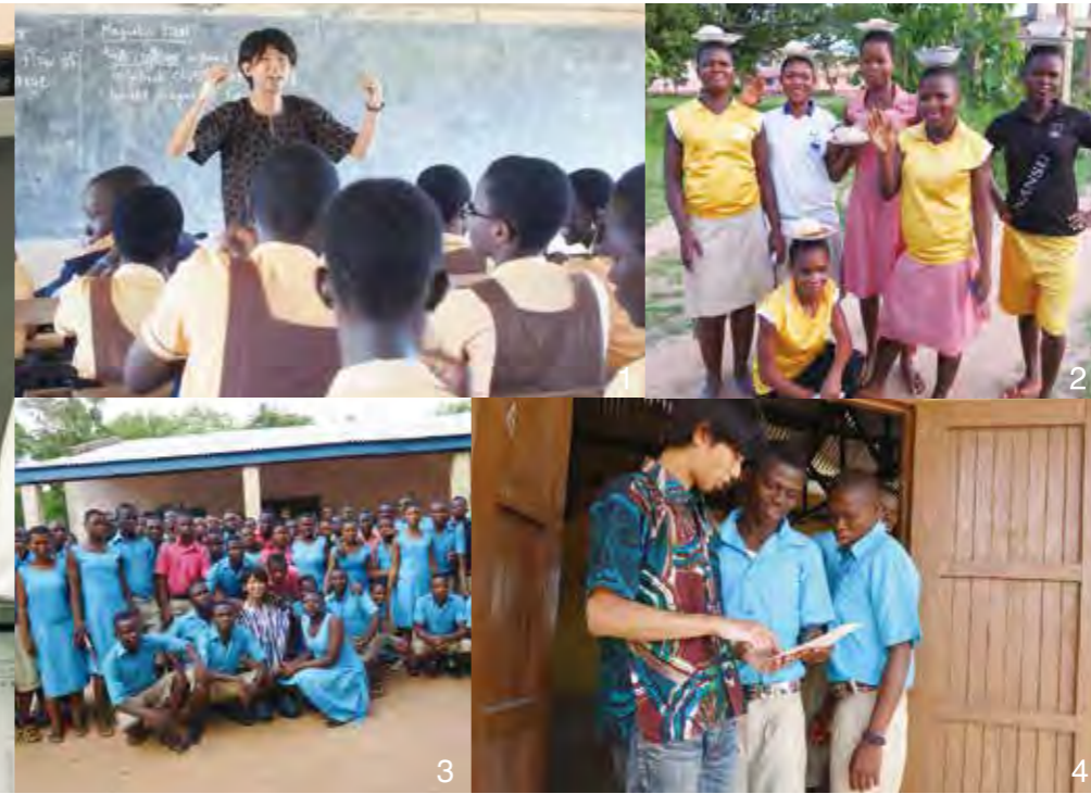
1.理数科ワークショップでの出張授業「電磁力とは?」 2.給食はもちろん頭で運びます 3.愛すべき生徒との最後の一枚 4.授業後の質問タイム