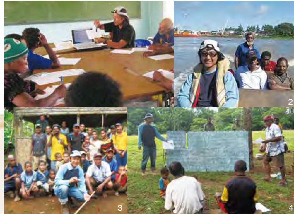
1.任地西州キウガにて地元有志に「ビジネスアイデア講習会」を開催 2.任地キウガでは、川を利用した移動が多い 3.村の巡回指導した時の集合写真 4.教会グループに「家計簿のすすめ」講座を開催

パプアニューギニアでの経験は、つくばFCを躍進させるための大きな原動力となるはずだ。