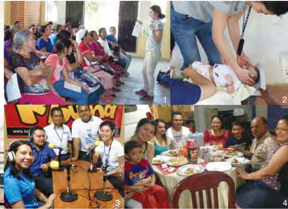
1.地域で始めた糖尿病患者向けの教室「糖尿病クラブ」 2.栄養失調児の家庭訪問 3.地元ラジオで活動(乳幼児健診や栄養教室の開催)紹介をした時のもの 4.友人の家で日本食パーティ

最も重要と考える現場は少し遠く離れた。「現場の意見を吸い上げながら、何が必要か、何ができるか」を考えていきたいと現在の心境を語る。時間ができれば、現場に赴き、現場の様子を肌で感じたいと考えている。