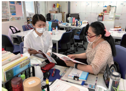
フィリピン出身の先生と外国語のレッスンプランの打ち合せ。子どもたちの可能性を伸ばすため、日々意見を交換し合っている。