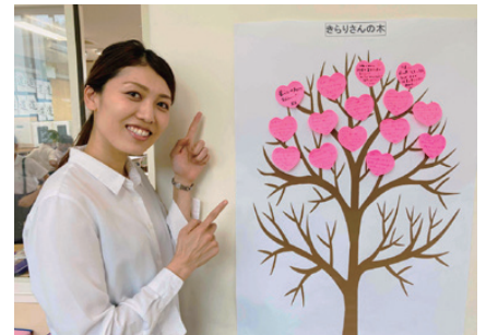
学校全体の取り組みとして、子どもたちの良い行動を付箋に書いて掲示している。彼らの自己肯定感アップを願い、温かいまなざしで見守っている。