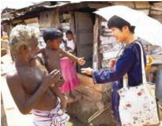
1993年当時、再定住地を巡回する青少年活動隊員。この後、住民の意見を反映させた住居改築が進んだ。

関）による有償資金協力案件「大コロombo圏水辺環境改善事業」との連携を開始した。川沿いの土地にいた都市住民が水辺の埋立地に移転した時には、電気、水道もトイレも不足していた。そこで隊員が担ったのは移転地で住民たちがより良い生活を実現するための支援である。例えば生活ゴミ対策、家庭菜園による栄養改善指導、小規模金融システムの育成、子ども会の活性化などの活動だった。