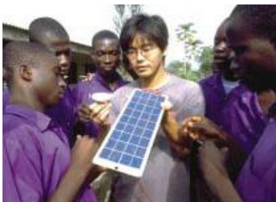
ガーナの理数科教師隊員の説明に生徒たちは興味津々

夫や技術を披露する格好の場になっている。さらに、他職種の隊員も、専門性や特技を生かした授業を受け持った。野菜隊員による「有機農法」、コンピュータ技術隊員による「インターネットについて」など、実践的な授業だ。こうした隊員同士の連携で、先輩隊員の経験が後輩隊員に引き継がれ、授業の質を高めるための協力技法が積み重ねられている。