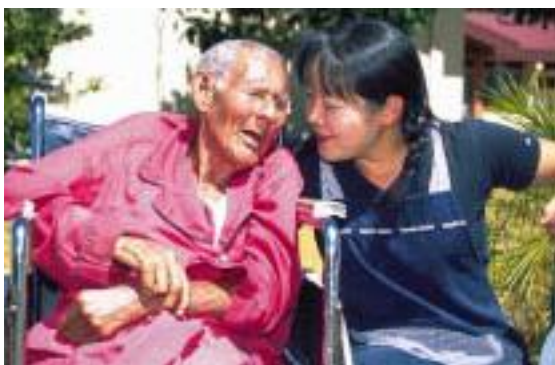
コスタリカの老人ホーム協会で活動するソーシャルワーカー隊員

協力隊初めての理学療法士隊員2人がコスタリカに赴任したのは1979年。以来、同国では作業療法士・竹工芸・養護・ソーシャルワーカーといった職種40人近い隊員たちが障害者・高齢者の福祉分野で活動してきた。当初は都市部で、数年後からは現