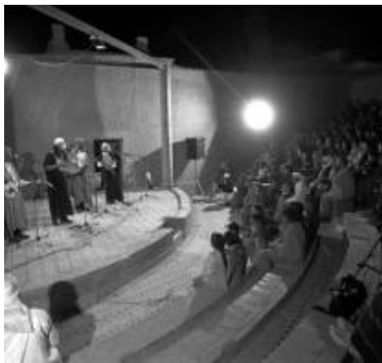
モロッコの建築隊員が設計した野外劇場でのコンサート

モロッコへの建築隊員の派遣は1970年からで、現在まで公園や橋などの公共施設の整備、同国の伝統建築物の整備・修復などの分野で活躍している。