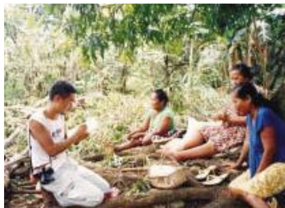
聞き取り調査中のミクロネシア考古学隊員

ミクロネシアへの考古学隊員は1991年から3代にわたって派遣され、現地の人々と共に開設した博物