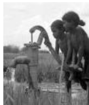
手押しポンプで灌水する子どもたち

隊員たちは、現地の女性たちの潜在的な力を引き出す「触媒」の役割を果たしたのである。こうして10年以上にわたって手工芸・婦人子供服・市場調査隊員を加え、50人近くの隊員が活動し、女性の社会参加を促進していった。首都の展示販売所は現在も村の女性のための販売ルートとして活用されている。