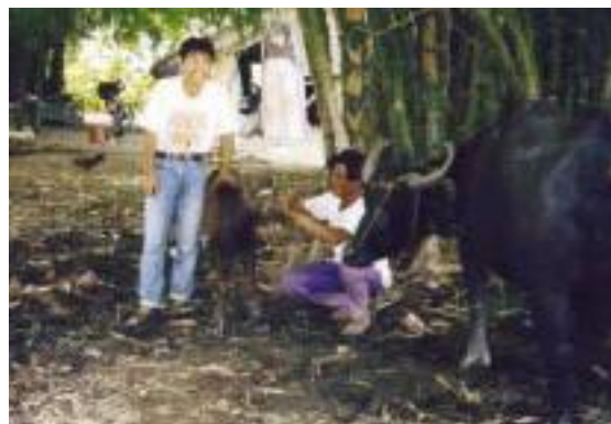
農民が大切にしている水牛の親仔と家畜飼育隊員

これら協力の成果と情報を基に、1989年協力隊員のチームによる「家畜人工授精強化プロジェクト」が開始された。貧しい農民たちの貴重な牛や水牛に、能力の高い仔牛を授けたいというのが隊員たちの思い