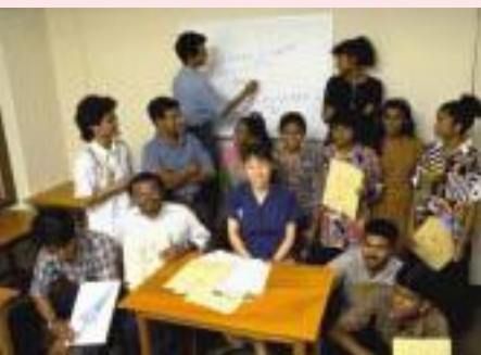
雇用創出にもつながったモルディブでの日本語教育

日本語教師隊員の派遣は1965年の協力隊事業開始とともに始まった。ラオスへの2人を皮切りに、現在まで1,300人超の隊員が世界各地で日本語学習者を支援している。