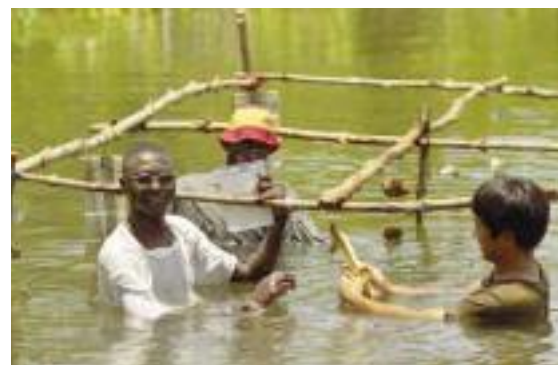
棚垂下式養殖によるカキの育成状況を調査する隊員と同僚

しかし、マングローブ林の減少や移動漁民によるカキの乱獲などにより天然カキは著しく減少。そこで村民は、採取のみでなく隊員の協力でカキ養殖を進めたが、高度な養殖技術導入には、地元の経済力を超えた設備投資や専門知識・経験が必要だった。