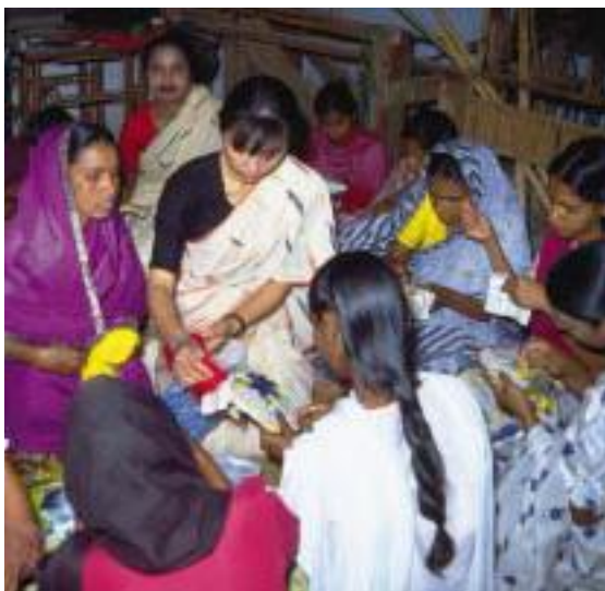
村の女性たちに刺繍を指導する手工芸隊員

洪水被害がある一方、干ばつへの取り組みも大きな課題だった。農業用水でさえ水瓶で運ぶ農民のために隊員たちが注目したのは、燃料費がかからない手押しポンプだった。稲作・園芸・農業機械・野菜隊員たちが現地農業改良普及員とともに各地域で手押しポンプの普及を図り、後任にも引き継がれていった。これにより、稲作だけでなくスイカやキュウリ、ダイコンなどの栽培が可能になり、現金収入の増加とともに農民たちの意欲が向上した。