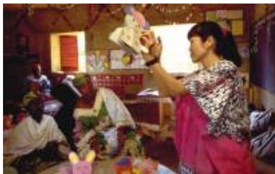
ニジェールでの 保育士の再教育を担当し、色紙を使った動物作りを指導する幼稚園教諭隊員

ネパールでは、ユニセフ（国連児童基金）の子どもと女性を対象としたプログラムと連携し、村落開発普及員隊員と栄養士隊員が、既存の体重測定所、