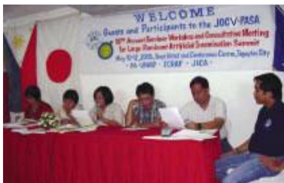
2005年にJOCV-PASA主催の第1回大型家畜人工授精サミットが開催された。

こういった現地での隊員活動に加え、日本での研修を通してフィリピン人の人工授精技術者が養成され、現地に技術が根付いていった。