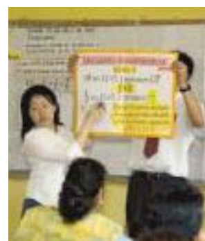
ホンジュラスの小学校教師たちに算数の指導法を講義する小学校教諭隊員

隊員たちが運営したこの研修会は、教師たちが算数を教える実力を高めた。参加者は教育大臣とJICAミクロネシア事務所長の連名の受講証明書を受けた。また新聞にも取り上げられるなど広く評価されたことで目に見えて教師たちのやる気が向上していった。