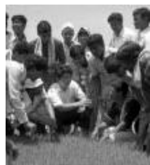
圃場で指導する稲作隊員