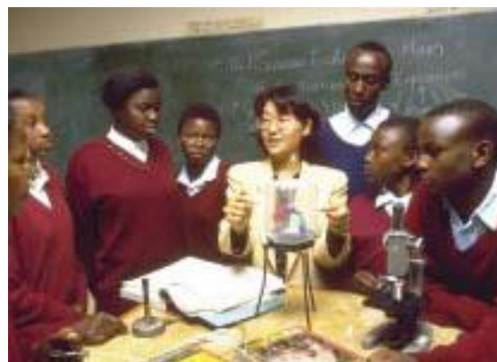
地方の公立学校で実験を取り入れた物理の授業を展開するケニアの理数科教師隊員

ケニアへ理数科教師隊員が派遣されるようになったのは1974年。主に地域社会が運営する学校で活動し、教師不足は徐々に解消に向かっている。