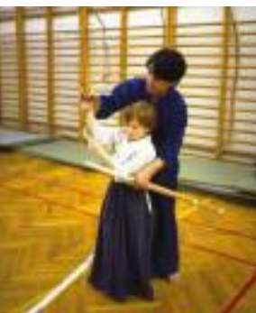
ハンガリーでも子どもから大人まで幅広い層が剣道に興味を持っている。

良い成績を収めてきたことがきっかけとなり、音楽教育の重要性が国内で次第に認識されるようになった。コンサートなどの経験を通じ、生徒自身も一生懸命練習した成果が人を感動させられることを知った。音楽家として将来を嘱望される生徒も現れ、子どもたちの世界を広げるきっかけにもなった。