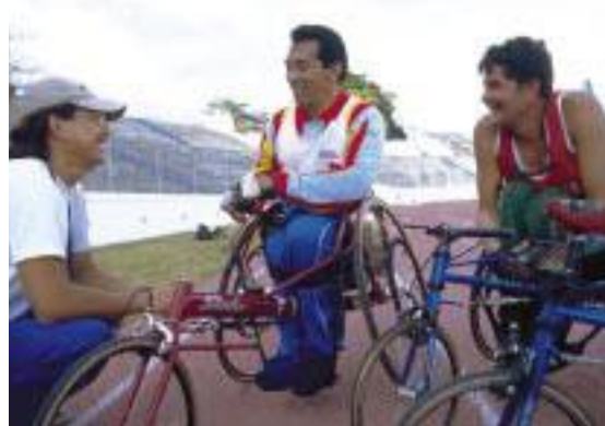
エルサルバドルで車いすスポーツを指導する養護隊員。国内大会開催などにより競技力を向上させ、ロサンゼルスシティマラソン、ホンジュラス国際ハーフマラソン、大分国際車いすマラソンなどに選手を引率した。

一方、中近東でも車いすスポーツにいち早く取り組んでいる。1987年からヨルダンで5人、90年からシリアで9人の隊員がこの分野で活動した。シリアでは体育隊員が10年間にわたり、障害者へのスポーツ普及と国民の障害者に対する意識喚起・認識向上を目的とし、障害者スポーツ協会で活動した。