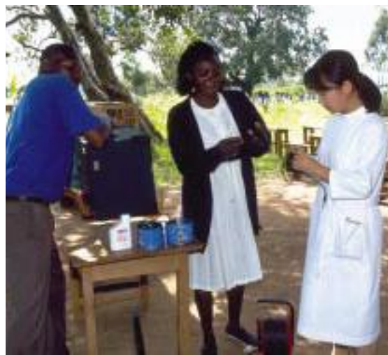
ケニアの村の小学校で啓発活動の準備をする保健師隊員と同僚