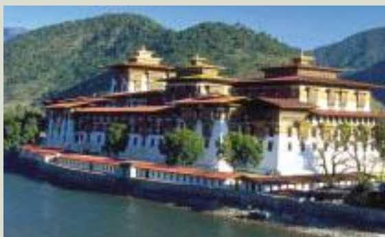
隊員が修復に携わったブナカ・ゾン。隊員は、修復・改築の過程で伝統的な特色が失われないよう、現況記録やオリジナルを残した工法を指導している。一方、文化財保護理念の啓発にも取り組んでいる。

ブータンには、ゾンと呼ばれる城砦建築など歴史的建築物が数多い。そうした建築物の修理・改築にあたる建築・建築施工隊員の活動は、10年を超える。