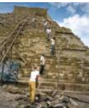
ホンジュラスのマヤ文明遺跡で作業する隊員たちと現地のスタッフ

[ホンジュラス・ミクロネシア・ブータン] 歴史的遺産の記録と継承へ向けて文化財の保護に向けた隊員たちの活動が、現地の人々の文化財に対する関心を高め、自分たちの身近にあるものが、人類共通の文化遺産であることを認識させた。ホンジュラスとミクロネシア、ブータンの活動を追った。