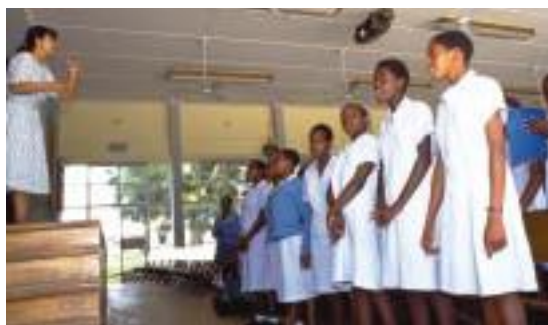
ジンバブエの学校で活動する音楽隊員

ジンバブエでは1991年以来100人を超える隊員が小・中・高校で音楽教師として地道に活動を続けてきた。その活動は教室内にとどまらず、合唱団の指導、地域コンサートの開催などに広がっていった。また、国内の音楽コンクールで隊員の赴任校が常に