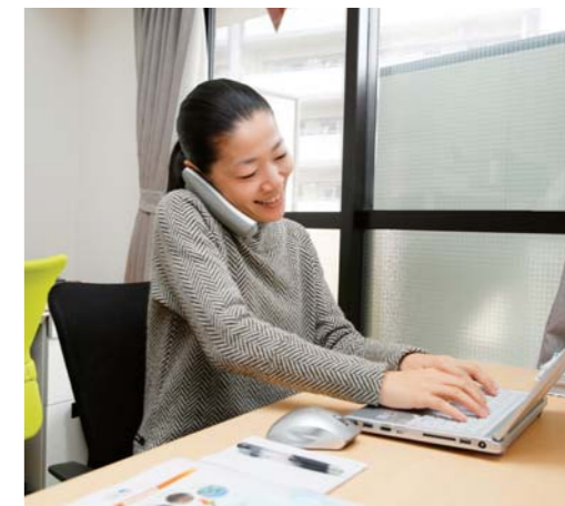
海外での活動に加え、オフィスでもエネルギーに活躍する。

決して、一方的に工法を教えるだけではない。現地の人とともに働くことで、自分たちも励まされる。何よりも、人々が自分たちのために道を作っていく過程を間近で見ることができるのが、このNPO法人の活動における醍醐味だという。