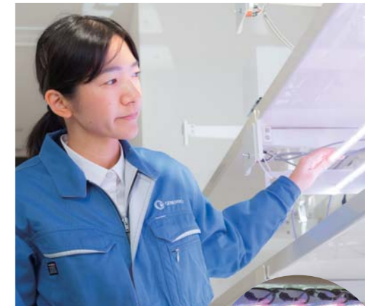
自社システムで開発したLED植物栽培装置の前で。

「とにかく、やってみるしかない。そこに何もなければ、自分で作っていくしかない。そんな状況に身を置いたことで、常に前向きに行動し、試行錯誤を繰り返しながら物事に挑む姿勢を身につけることができました」。