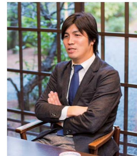
下鴨茶寮は2016年、東京・銀座にも出店される。