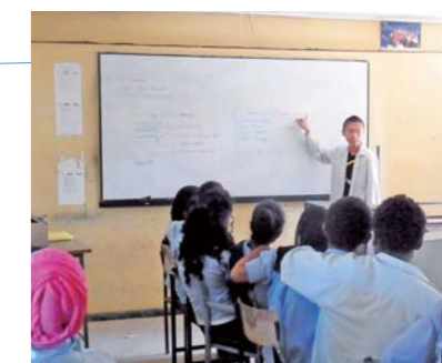
“セガワ先生”の授業を熱心に聞く生徒たち。