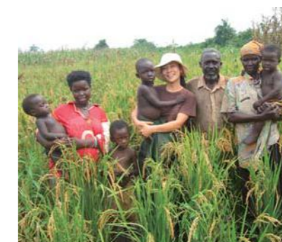
大豊作! 色づいたネリカ米の中で地元の農家家族と記念撮影。

は年に2回収穫ができる。滞在期間中に、その成果を見ることもできた。「ネリカ米で得たお金で養豚をはじめた現地のおばあさんが、嬉しそうに子豚を見せてくれました」。