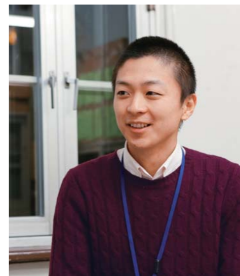
京都市役所には青年海外協力隊OB・OGが多数勤務している。