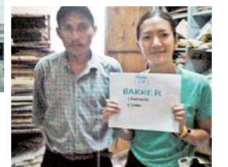
ゴミのポイ捨て防止キャンペーンのためにオリジナルソングも作成。