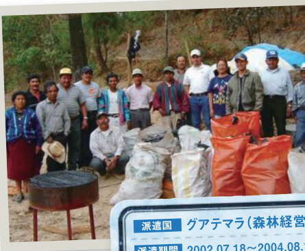
派遣国 グアテマラ(森林経営) 派遣期間 2002.07.18~2004.08.16