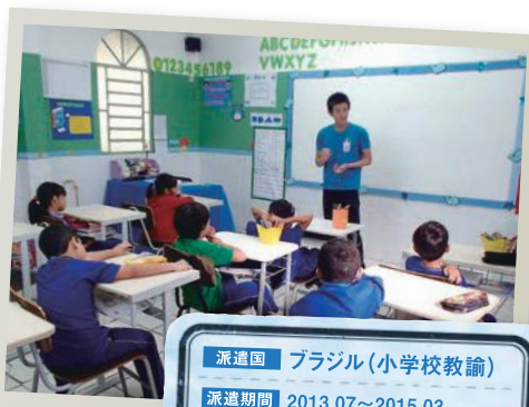
派遣国 ブラジル(小学校教諭) 派遣期間 2013.07~2015.03

ポルトガル語とブラジル文化理解が現在の仕事に役立っています。授業で異文化理解の心を養わせたり、外国籍の児童とコミュニケーションをとったりする際に、2年間で経験したことが生かされています。その他、どんなことに対しても「まずやってみる」という挑戦する気持ちや、物事を多角的に見ようとする意識が身についたことは、仕事だけでなく、人生にも役立っていると思います。さらに、いろいろな人と積極的にコミュニケーションをとり、自分の視野をもっと広げたいと思うようになったことは、日系社会青年ボランティアでの経験に影響を受けていると感じます。