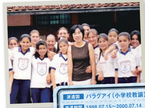
派遣国 パラグアイ(小学校教諭) 派遣期間 1998.07.15~2000.07.14