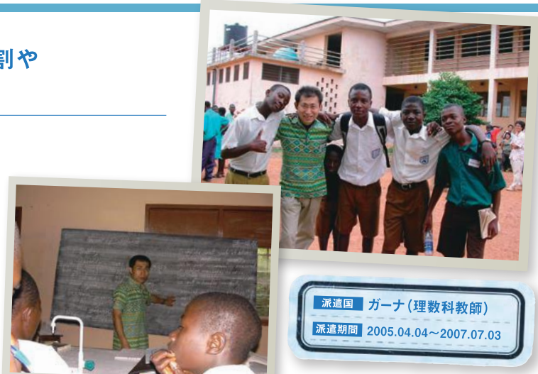
派遣国 ガーナ(理数科教師) 派遣期間 2005.04.04~2007.07.03

「いつかはアフリカに行って…」そんな思いとは裏腹に、通じない言葉、口に合わない食べ物、汚い住居など日本比でたら撒いとところはいろいろあった。「何のためにガーナに来たのか?」そんな自問自答を繰り返し、また必死で活動する。自分にできることは何でもやる。その強い思いを持って毎日過ごしていた。こんな協力隊の経験を通して、忍耐力や交渉力などの単なるスキルの向上のみならず、常に原点に立ち返って自分の役割や生きる意味を再認識することが大切だとわかった。人にはそれぞれ与えられた使命がある。そんな自分の使命を再認識することができた2年間であった。