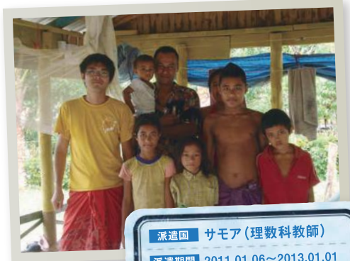
派遣国 サモア(理数科教師) 派遣期間 2011.01.06~2013.01.01