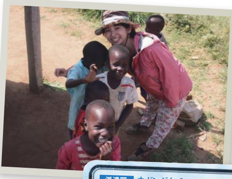
派遣国 ウガンダ(コミュニティ開発) 派遣期間 2012.09.24~2014.09.23

*ケニアレザーとマサイの伝統的な布を使った自社ブランドのバッグや小物などを販売する通販サイト会社を企業、運営