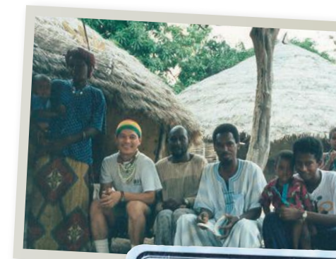
派遣国 セネガル(野菜) 派遣期間 1982.01~1984.03

セネガルの農村での活動で私が一番変わったのは、価値観。農村で生きることを意味でしょうか。イスラムの教えに従い、サハラ砂漠の南下に伴い、時には限られた食料をムラの中で分けるような非常に厳しい環境の中でも、農村の人たちは遅く、楽しみながら生きています。自分が暮らす日本の山村は途上国の農村よりも、そこで暮らす人に優しく、本当に豊かでしょうか。何百年と継続されてきた文化はこれからも維持継続されていくでしょうか。自分がいなくても自立継続できるような活動にしたいと考えたことは、自分が帰国後の家で茶栽培に生きています。農業不使用栽培循環型農業をめざしてお茶を作る。モノカルチャーのリスク回避に、多品種化と製法の多様化で複数の農産品を作るようになりました。自分で考え、行動し、失敗や体験を通して、自分の住む地域に合った管理をすればオリジナルのお茶作りが、立派にできることを茶園で表現できるようになったと思っています。