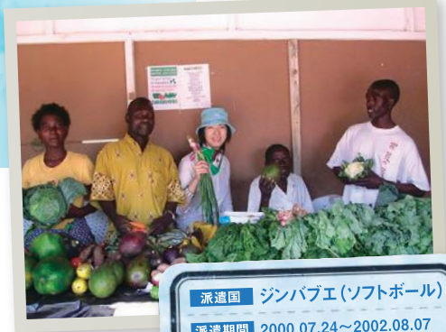
派遣国 ジンバブエ(ソフトボール) 派遣期間 2000.07.24~2002.08.07