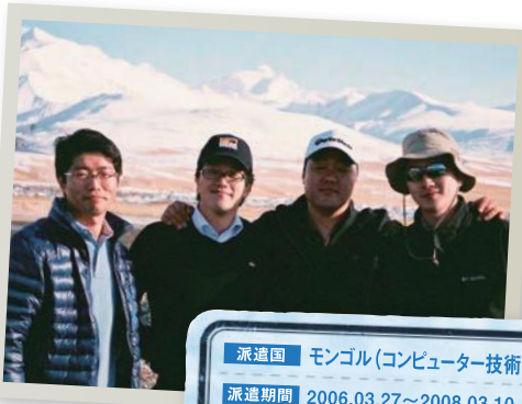
派遣国 モンゴル(コンピューター技術) 派遣期間 2006.03.27~2008.03.10

開発途上にある国のライフスタイルを研究してバイクを企画する社内プロジェクトに、2016年に参画しました。将来の顧客の金銭感覚や判断基準を考慮してアイデアを出す際、現地の生活水準で暮らした2年間の経験が役に立ちました。アメリカに詳しく英語を話す日本人は星の数ほどいます。しかし、小国の言葉を話し、そこに深い人脈を持つ日本人は少なく、ビジネスに不可欠な差別化につながります。青年海外協力隊をきっかけにモンゴル語とモンゴルに伝手を得たことは、その後の私のアイデンティティーになっています。