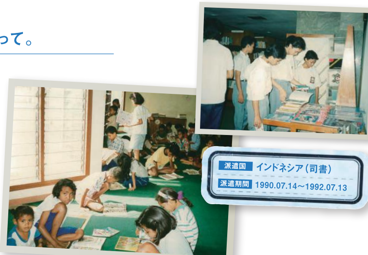
派遣国 インドネシア(司書) 派遣期間 1990.07.14~1992.07.13

ハングリー精神。無い無い尽くしても諦めないという心。人間関係の濃厚さ。利他の心。感謝の念。人生で重要なこと。夢を持ち続けることの大切さ。そして、人脈...でしょうか。さらには、視野の広がり、地球規模で物事を考える癖が身についた気がします。東伊豆町立図書館では私が館長になってからは毎年、7月29日の開館記念日に「ワールド・フェスタ世界を体験できる一日」を元青年海外協力隊の協力をかり開催しています。その前後1か月間あまりJICAの協力を得て「青年海外協力隊写真展 Be with you」も開催。教育格差や受験競争、いじめ、不登校、心の病、自殺などがある日本の青少年にも、たくましく夢に向かって自分らしく明るく生きて欲しいと願って開催しています。