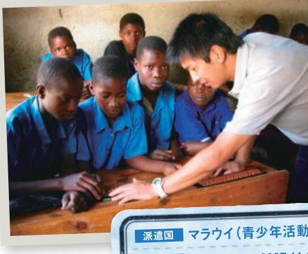
派遣国 マラウイ(青少年活動) 派遣期間 2005.11.28~2007.11.27