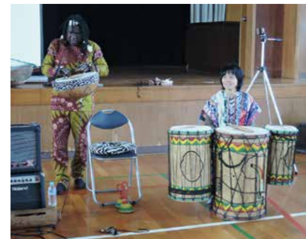
ご主人との演奏風景