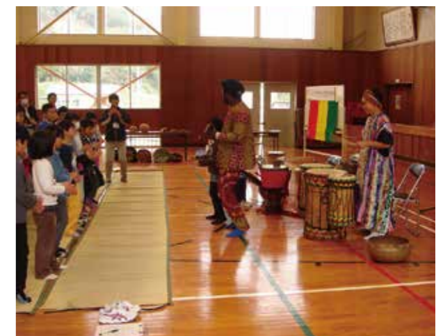
ご主人との演奏風景

「主人は基本的に物静かですが、演奏活動など日本で活動する上でさまざまな問題が起こります。そんなとき私に、“できないと思ったらできない、できると思ったらできる”と強く言います。そんなとても前向きな主人に背中を押してもらいながら、私も前を向いていきたいです」