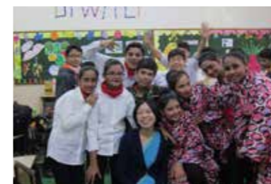
(上)学校の子どもたちと (左)派遣先の学校で