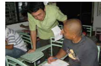
(上)島の学校で生徒たちと (左)夜間学校でも理科を教える