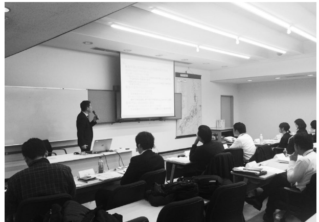
国際協力人材赴任前研修を受講するJICA専門家

多方面の取り組みを行ってきたが、2004年、独立行政法人化前後の情勢変化を踏まえて国際協力人材の確保・養成に関する基本方針案の検討を行い、国際協力人材に求められる6つの資質、能力を、①分野・課題専門力、②総合マネジメント力、③問題発見・調査分析力、④コミュニケーション力、⑤地域関連知識・経験、⑥援助関連知識・経験、と整理したうえで、2006年度に事業の抜本的な見直しを行った。その結果、現在は、大別して次の4類の事業を実施している。①派遣前の専門家に協力活動に必要な知見、技能を付与するための「国際協力人材赴任前研修」、②即戦力としての活躍が期待される人材の短期間での能力強化を目的とした「能力強化研