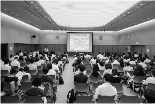
国際協力に関心のある若手社会人や学生を主な対象に、キャリア形成のために有益な情報を提供する「キャリアセミナー」 2017年

修」、③一定の専門性を持ち将来活躍が期待される若い人材に対して開発協力の実務経験を付与する「ジュニア専門員制度」、④開発協力にかかわる人材の裾野拡大を目的とした「インターンシップ」や「キャリアセミナー」などの情報発信である。