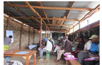
写真) ジェンダー研修の様子

具体的には、「ジェンダー研修」を、プロジェクトが支援対象とする農家以外のグループや隣接